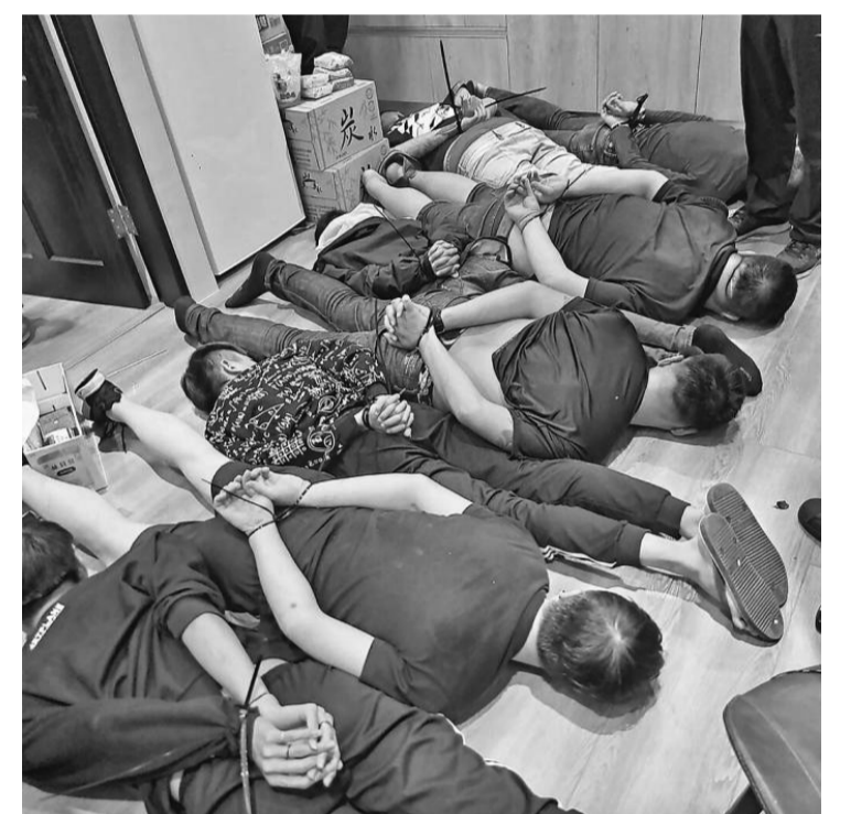
图为落网的诈骗集团共犯。