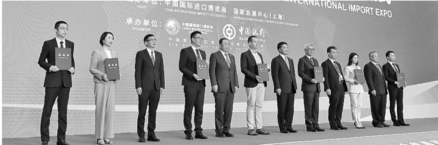
11月6日,2022年中国国际进口博览会参展商联盟大会在上海举行。这是在大会期间进行的第六届进博会参展商签约仪式。