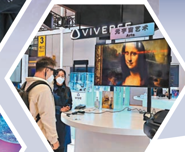
▲元宇宙藝術展讓體驗者近距離參觀世界名畫。