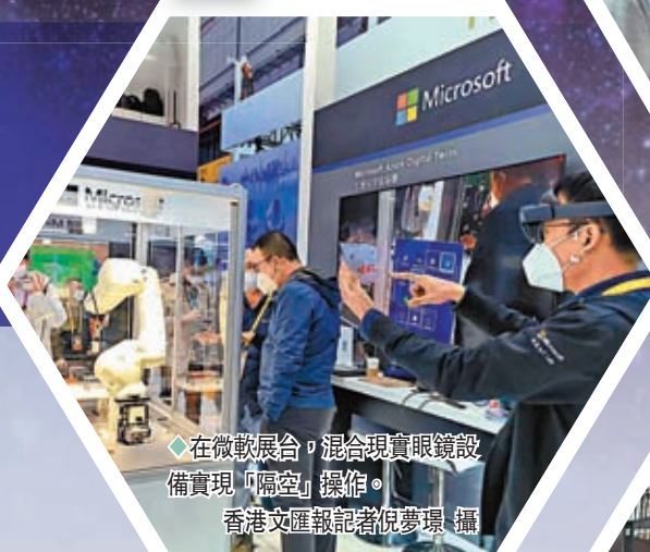
◆在微軟展區, 混合現實眼鏡設備實現「隔空」操作。