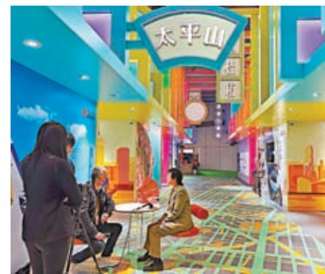
◆香港旅遊推介, 勾起了觀眾對香港的思念。

為主題, 展示香港各項專業服務, 涵蓋品牌及營銷推廣、品牌授權、產品設計、建築設計、金融服務、信息及通訊技術、專業服務、智慧供應鏈、醫療科技及政府服務等。緊貼元宇宙市場趨勢, 有不少公司展示創新科技服務, 例如有專攻Web3藝術科技社交市場的PONS.ai 澎思, 帶來AI工具和服務的一站式平台, 可為客戶創建個人化的數字藝術珍藏品。