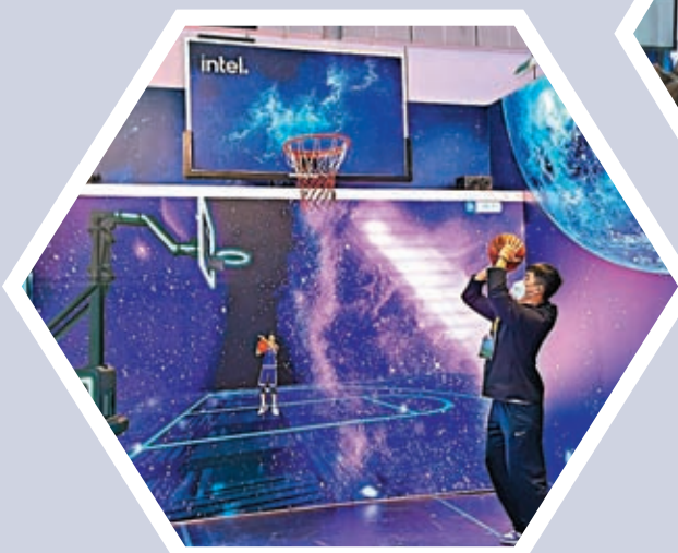
◆英特爾為進博會現場帶來元宇宙籃球互動體驗。

協議, 這也是本屆進博會的民航業採購首單。而本屆進博會期間, 東航將簽下15份訂單, 涉及美國、英國、德國、荷蘭、新加坡、香港等8個國家和地區的全球知名供應商, 「購物車」總金額將超過16億美元。