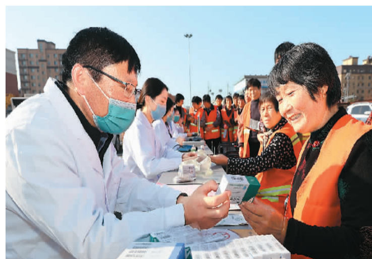
近日，江苏省连云港市赣榆区柘汪镇面向当地环卫工人开展免费健康体检活动。

徐爱民介绍，随着影像学手段和检查技术的进步，发现结节变得越来越容易。当前，体检中检出率较高、较为常见的结节有肺结节、乳腺结节和甲状腺结节。