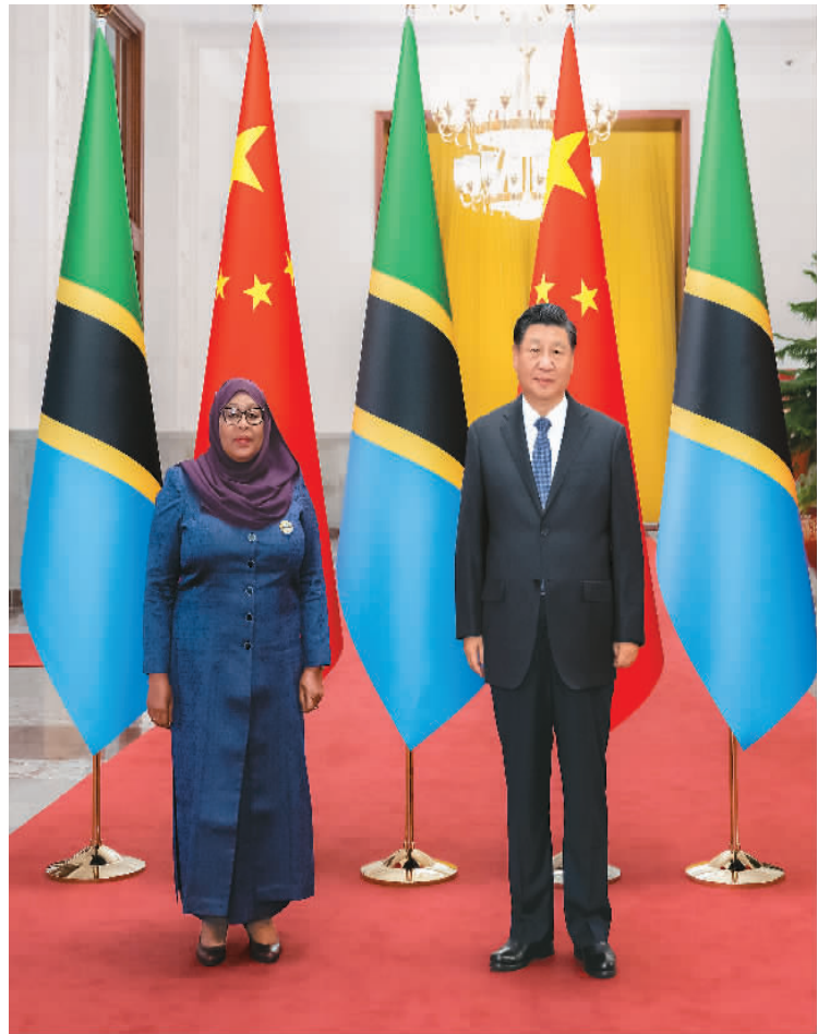
十一月三日, 国家主席习近平在北京人民大会堂同来华进行国事访问的坦桑尼亚总统哈桑举行会谈。这是会谈前, 习近平在人民大会堂北大厅为哈桑举行欢迎仪式。

新华社北京11月3日电 国家主席习近平11月3日下午在人民大会堂同来华进行国事访问的坦桑尼亚总统哈桑举行会谈。两国元首宣布, 将中坦关系提升为全面战略合作伙伴关系。