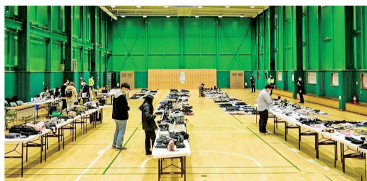
当地时间11月1日,首尔梨泰院区,警方从万圣节梨泰院踩踏事故现场取回的物品在体育馆中等待遇难者家属前来领取。

当地时间10月29日晚,首尔梨泰院一带发生大规模踩踏事故,超过300人死伤。事故发生后,韩国政府宣布从10月30日至11月5日晚24时为“国家哀悼期”。