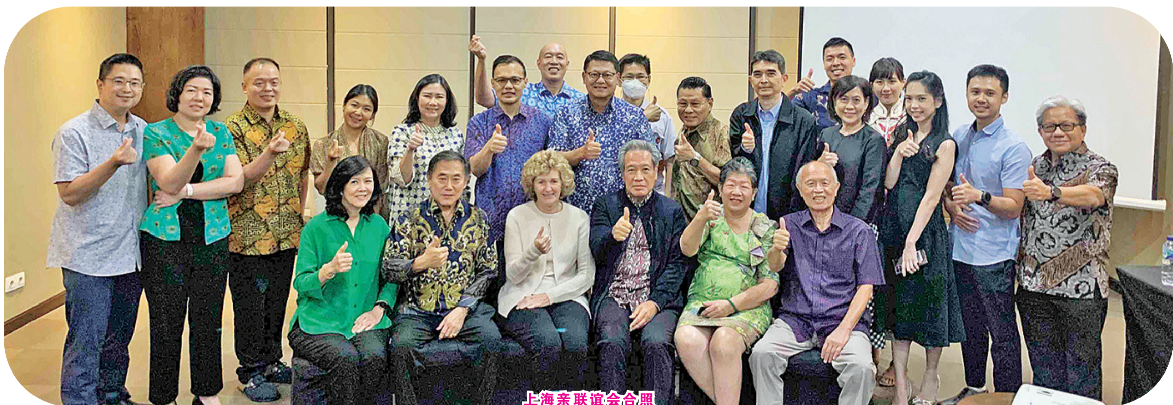
上海亲联谊会合照