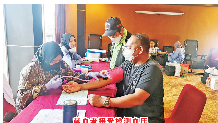
献血者接受检测血压