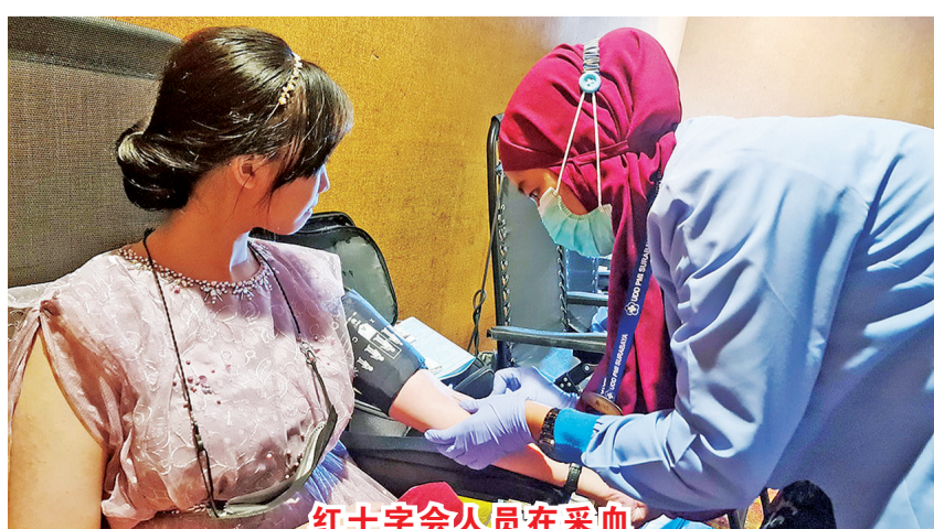
红十字会人员在采血