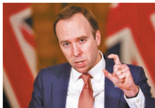
◆漢考克參演英國長壽真人秀《我是名人,救我出去!》。 資料圖片

處理議員職責,據報保守黨高層在知道消息後非常憤怒,黨鞭哈特1日與漢考克會面後,認為情節嚴重,決定即時暫停漢考克的黨籍,意味他只能以無黨派議員身份出席國會會議。首相蘇納克亦批評漢考克的決定,認為後者在國家面對多重危機之際,卻放棄職務去拍真人秀,對選民不負責任。報道引述消息指,在黨魁選舉期間支持蘇納克的漢考克,因為認為自己已經無機會再擔任內閣職位,所以決定參演真人秀,「以另一種方式與英國民眾接觸」。 ◆綜合報道