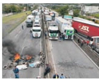
◆支持博爾索納羅的司機封鎖高速公路焚燒輪胎。