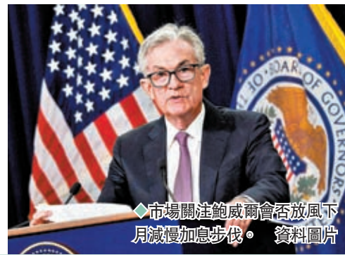
◆市場關注鮑威爾會否放風下月減慢加息步伐。 資料圖片

《華爾街日報》兩星期前曾報道,聯儲局傾向在今次加息0.75厘,但局內理事準備就12月份的加息幅度進行辯論。報道一出,市場對聯儲局12月份加息幅度的預期出現明顯變化。聯邦基金利率期貨市場顯示,交易員預計12月份加息0.5厘的概率為44.6%,0.75厘的概率為49.5%,反映市場仍然不確定聯儲局今後方向。 ◆綜合報道