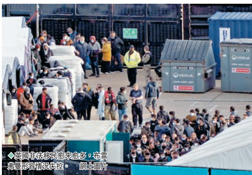
◆英國非法移民愈來愈多,布雷弗曼形容情況失控。 網上圖片