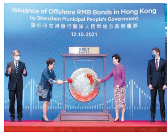
深圳市政府去年成功首發離岸人民幣地方債，開創了地方政府在境外發行離岸人民幣債券的先河。

據悉，此次深圳市預計在香港籌建發行50億元離岸人民幣地方政府債券，發行期限爲2、3、5年期。其中，3年期爲綠色債券，用於地鐵四期調整項目；5年期爲藍色債券，用於水污染治理項目。此次債券的利息收入將免徵香港利得稅及香港印花稅。此外，此次債券已由香港金融管理局納入人民幣流動資金安排的合資格抵押品名單，證券功能及交易場景的拓寬將有助於提升本次債券的流動性水平。