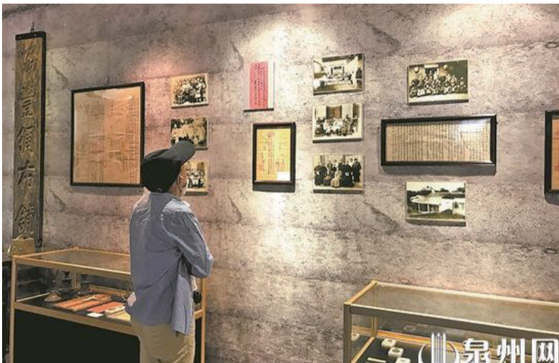
展覽內涵深厚，實物展品豐富多樣。

百年中山路承載着海外游子的鄉愁記憶、鐫刻着泉州的商業變遷、沉澱着泉州的人文精神。近日，“宋元泉州城 百年中山路”中山路藏品展在中山路406號展出，吸引了不少市民前來參觀。從老照片、老物件中追尋百年中山路的痕迹，可以看到中山路的商業氣氛一直延續至今。記者了解到，展覽將持續至10月28日。