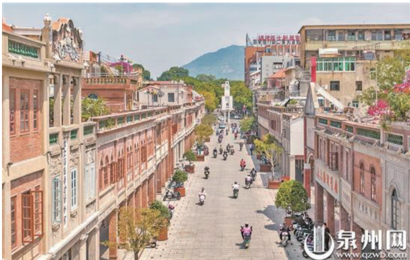
中山路的商業氣氛一直延續至今