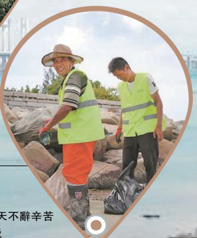
清潔工人每天不辭辛勞 清理礁石間的垃圾