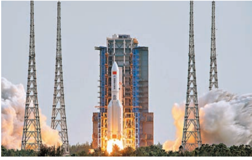
10月31日，搭載中國空間站夢天實驗艙的長征五號B遙四運載火箭，在文昌航天發射場發射升空。

中國載人航天工程辦公室主任郝淳介紹，今年完成空間站在軌建造以後，工程將轉入為期10年以上的應用與發展階段。初步計劃是每年發射兩艘載人飛船和兩艘貨運飛船。隨着空間站的「擴建」，神舟十四號和神舟十五號乘組的6名航天员將有共同在軌駐留的機會。兩個乘組都將「出差」半年，並首次進行在軌乘組輪換，實現空間站不間斷有人駐留。這意味着，空間站在軌建造完成後，中國航天员將在太空中「會師」，創造中國航天的歷史性時刻。