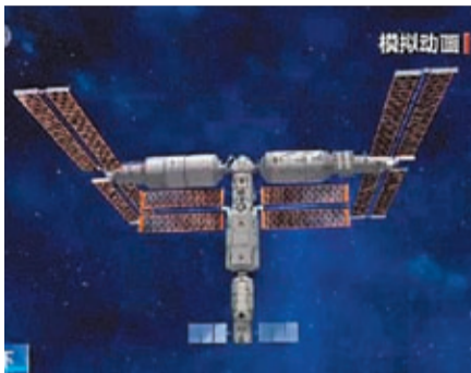
中國空間站T字構型示意圖。視頻截圖報告中指出，空間站作為中國最重要的綜合性近地空間研究基地，要努力爭取在前沿基礎研究領域進入國際前沿，在應用基礎和技術方面解決國家重大需求，為經濟社會發展加強高質量科技供給，產生顯著效益。

因為是中國空間站建造進入收官階段的發射任務，今天來送夢天的航天人格外多。夢天實驗艙是中國空間站第三個艙段，主要用於開展空間科學與應用實驗，參與空間站組合體管理，貨物氣閘艙可支持貨物自動進出艙，為艙內外科學實驗提供支持。後續，夢天實驗艙將按照預定程序與空間站組合體交會對接。完成有關功能測試後，夢天實驗艙將按計劃實施轉位。