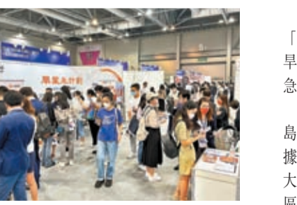
為期兩天的國際人才嘉年華吸引超過2萬人次入場。受訪者供圖

香港文匯報訊 (記者文禮顯) 香港特區行政長官李家超於任內首份施政報告提出「搶人才、搶企業」，一連兩天在亞洲博覽館舉行的第三屆「創新香港——國際人才嘉年華」10月30日圓滿結束，短短兩日在網上和網下吸引2萬人次報名，分別應徵逾五千個來自近百家創新創科企業的職位。香港大公文匯傳媒集團亦有在現場設立攤位，提供採編、行政等大量全職、優質崗位，現場所見，攤位內氣氛熱烈，求職者絡繹不絕。是次展會是一個集國際人才招聘會、論壇和工作坊於一身的大型盛事，冀打造由香港驅動、惠及大灣區的持續創新人才生態圈，吸引近百家創新創科企業參展，覆蓋資訊科技、生物科技、金融科技、房地產等領域，提供超過五千個崗位，吸引香港及全球人才留港來港發展，為香港發展創科提供人力資源儲備。兩天的嘉年華入場人次超過2萬人次。主辦方表示，對反應如此熱烈感到喜出