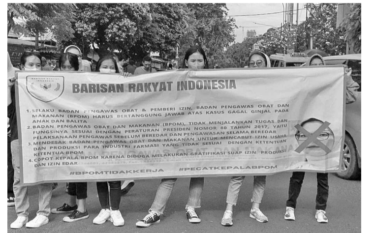
印度尼西亚国阵组织(BARIS)的示威群众

【本报讯】一些属于印度尼西亚国阵组织(BARIS)的群众在药物与食品监督机构(BPOM)办公大楼前举行抗议示威。