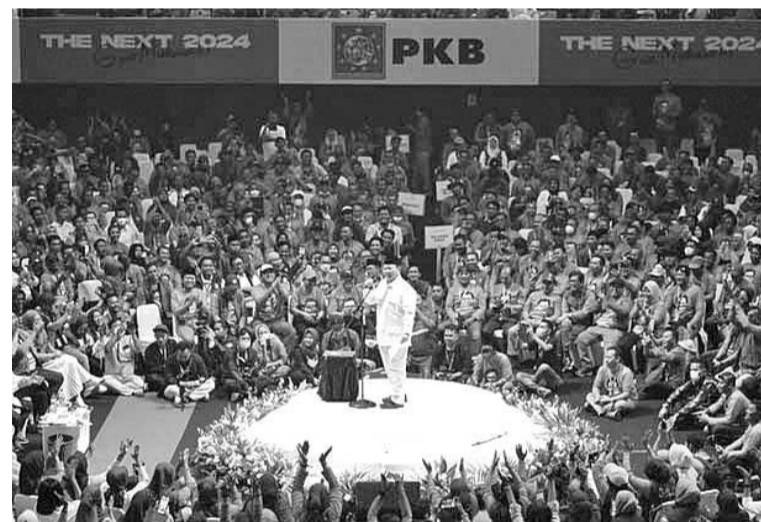
普拉波沃赞赏穆海敏并非谋财政客