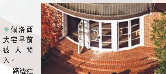
佩洛西大宅早晨被入侵。