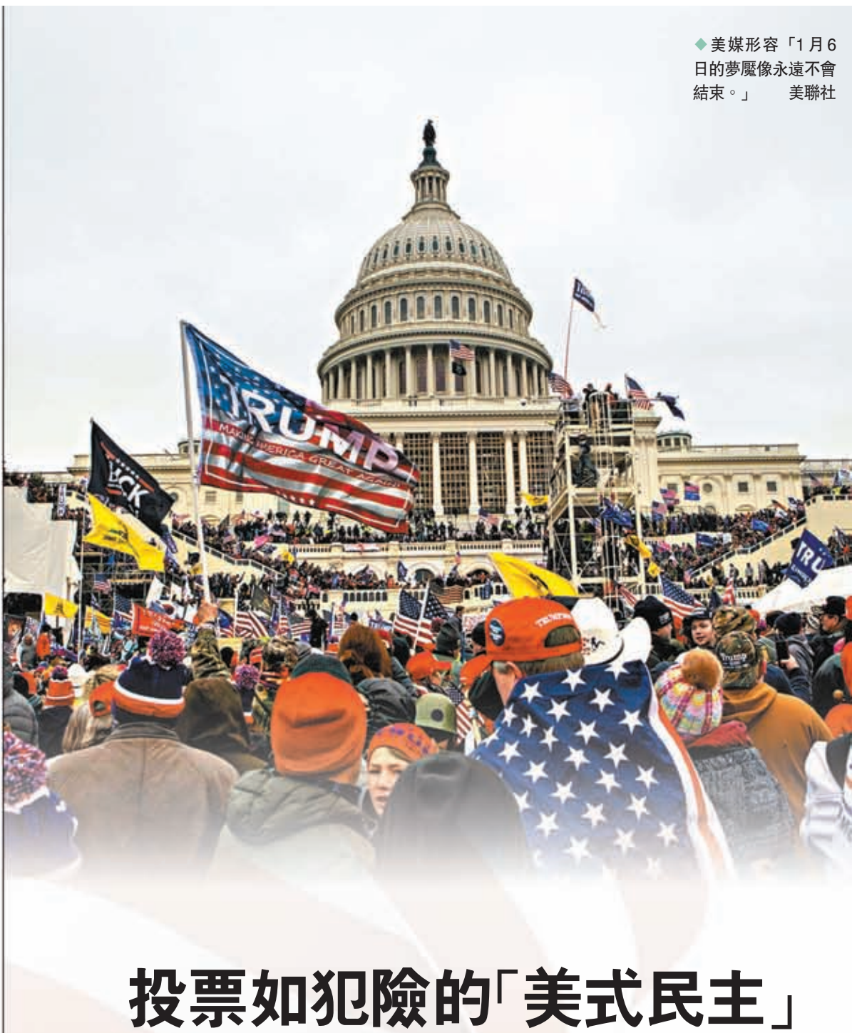
◆美媒形容「1月6日的夢魘像永遠不會結束。」