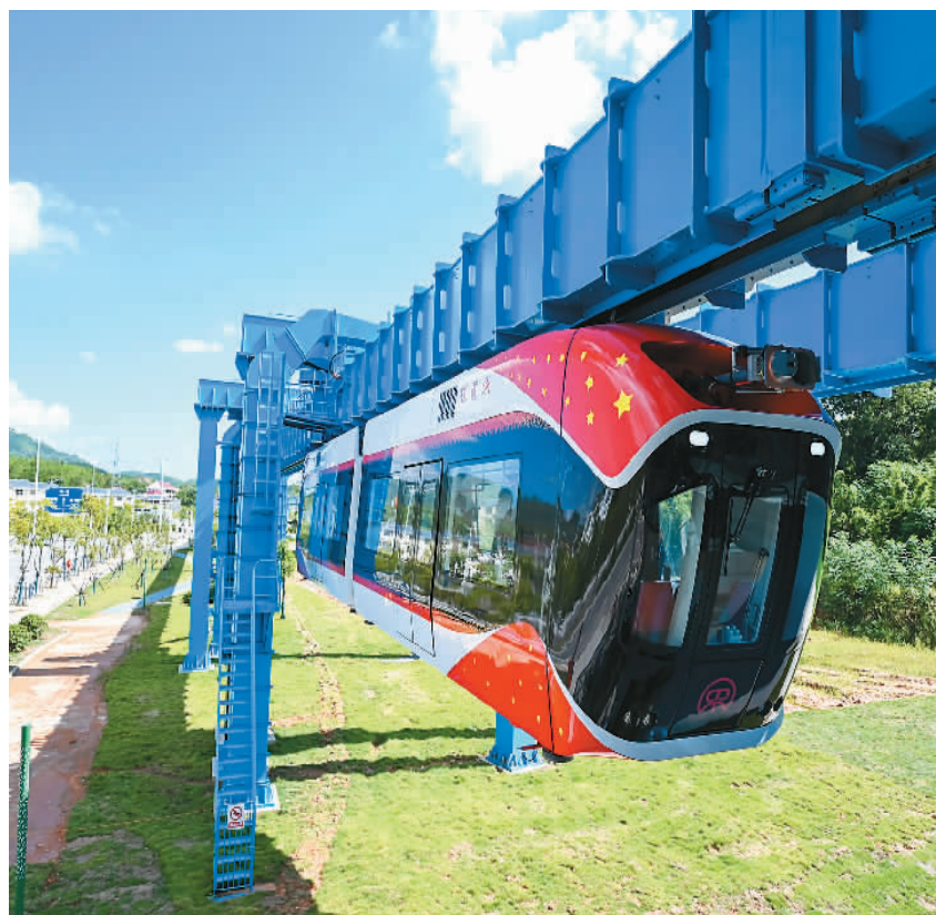
▲ 自主创新能力不断增强。8月9日,我国具有完全自主知识产权的国内首条稀土永磁磁浮轨道交通工程试验线——“红轨”在江西省兴国县正式竣工。图为行驶中的“红轨”试验线列车。