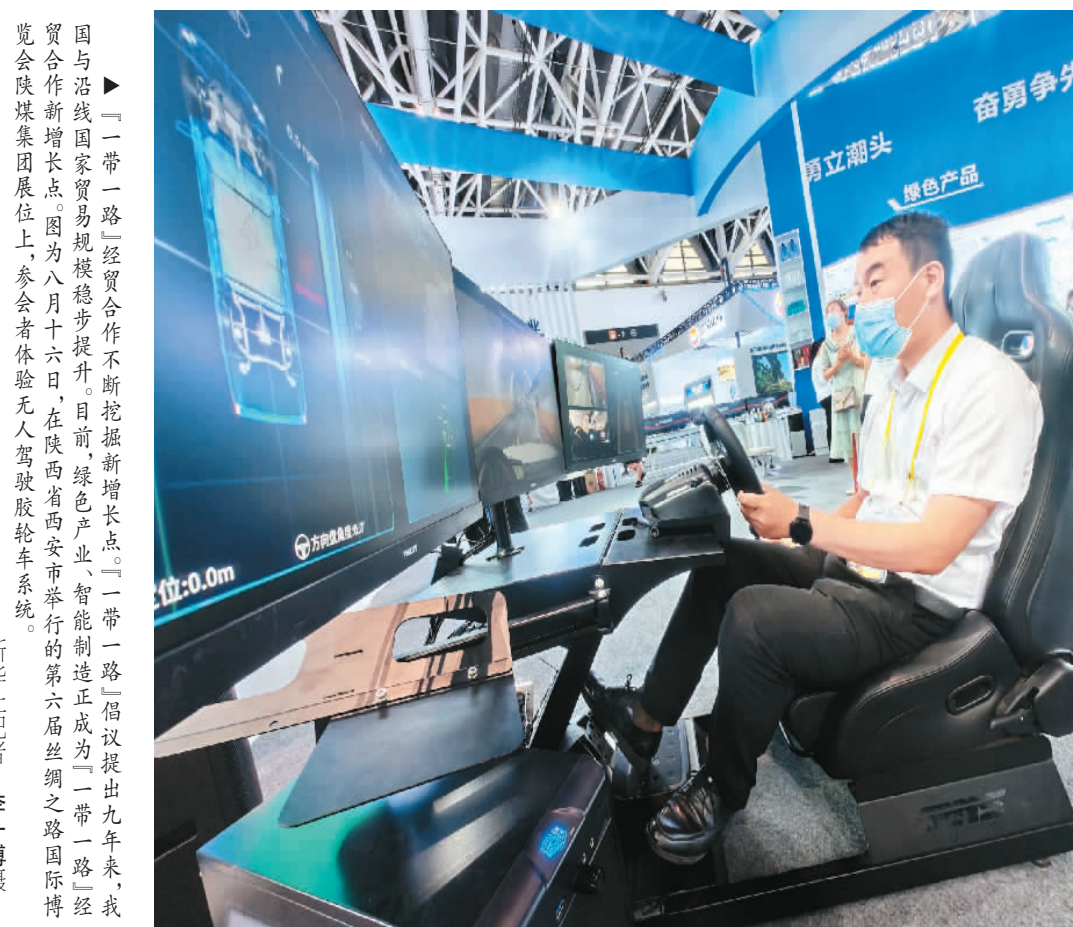
▶ “一带一路”经贸合作不断挖掘新增增长点。“一带一路”倡议提出九年来,我国与沿线国家贸易规模稳步提升。目前,绿色产业、智能制造正成为“一带一路”经贸合作新增增长点。图为八月十六日,在陕西省西安市举行的第六届丝绸之路国际博览会陕煤集团展位上,参会者体验无人驾驶轿车系统。