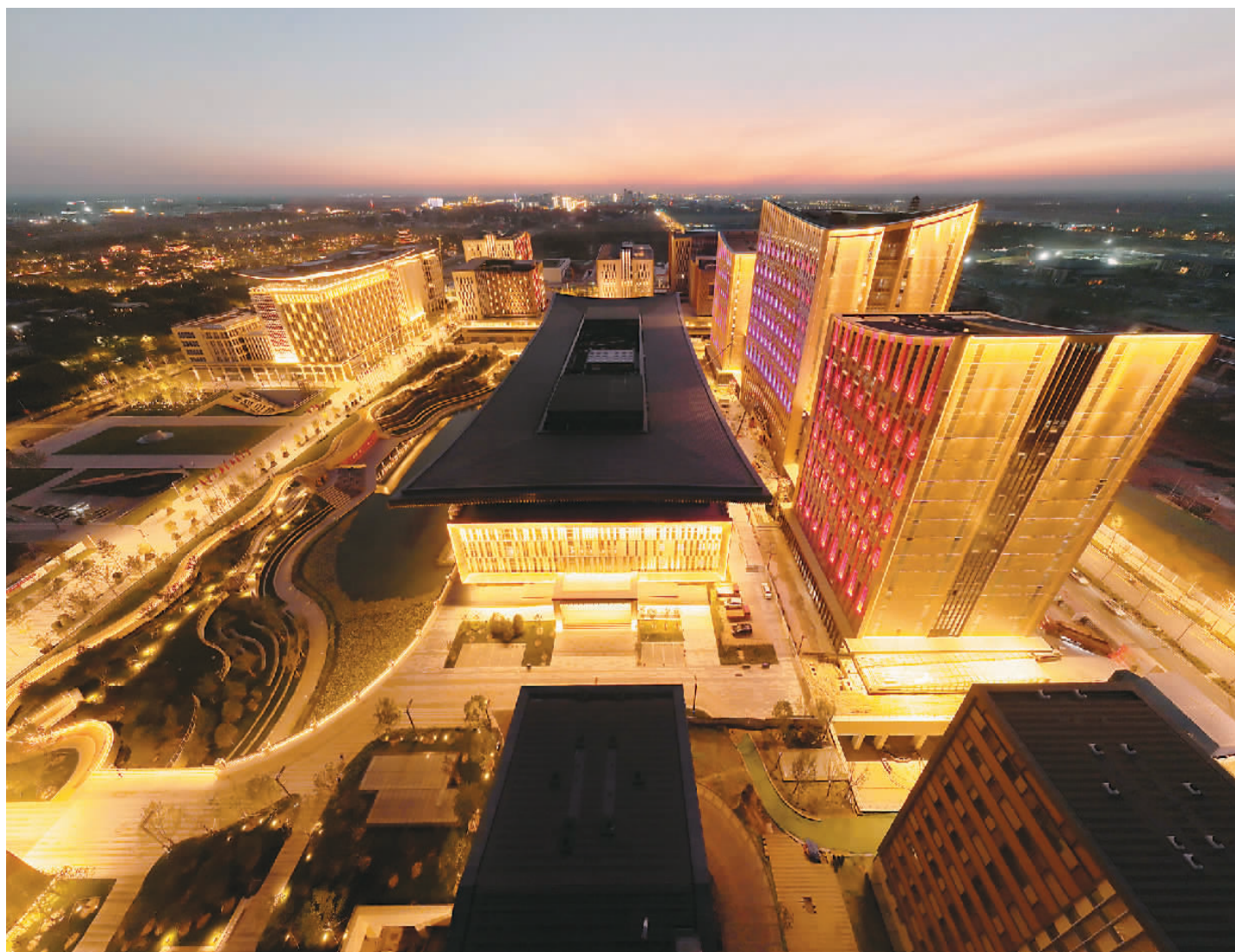
▶ 未来之城日新月异。2017年至今,雄安新区从“一张白纸”着墨,每天都在积蓄力量、拔节生长。图为2022年9月7日拍摄的雄安新区商务服务中心。