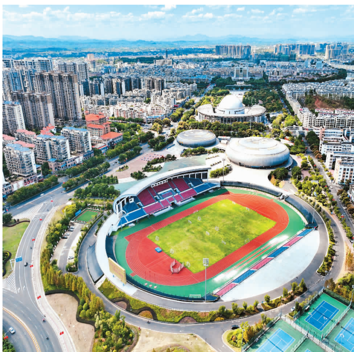
▲ 市民健身有了新去处。近年来,江西省赣州市把建设体育公园作为提高城市品位、完善城市绿地系统的重要举措,打造人与自然和谐相处的城市,使老百姓享有更多惬意的休闲空间。图为10月26日拍摄的赣州市南康区体育公园。