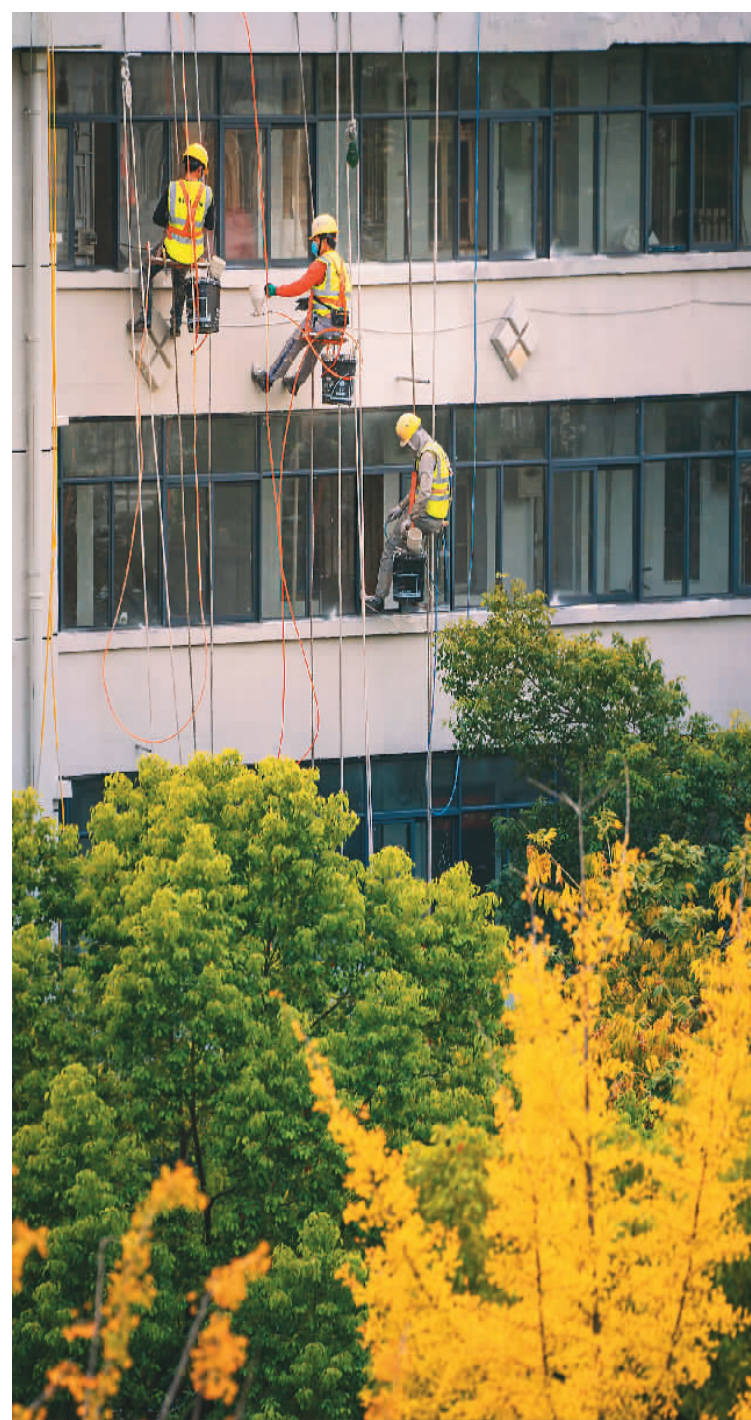
▲ 共享发展持续加强,居住环境焕然一新。安徽省马鞍山市持续推进老旧小区改造,实现老旧小区共建共治共享,让其真正成为老百姓满意的幸福工程、民心工程。图为10月21日,工作人员正在马鞍山市花山区矿山新村楼房外粉刷墙面。