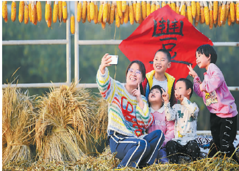
陕西省西安市长安区将水稻种植与旅游观光产业相结合，助力乡村高质量发展。图为人们在稻田景观上合影。

福建省龙岩市新罗区小池镇培斜村曾是一个“无产业、无人才、无技术”的贫困村，通过发展乡村旅游，如今已成为