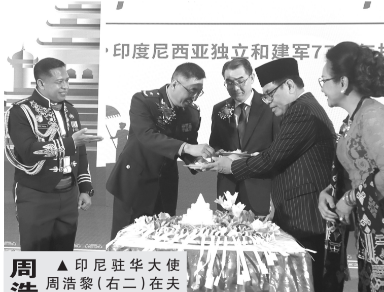
周浩黎大使举行印尼独立77周年纪念会

政府将控制管理的11种主要粮食原材料分别是大米、玉蜀黍、黄豆、葱头、辣椒、禽肉、禽蛋,反刍动物肉、食用糖、食用油和鱼类。(Sm)