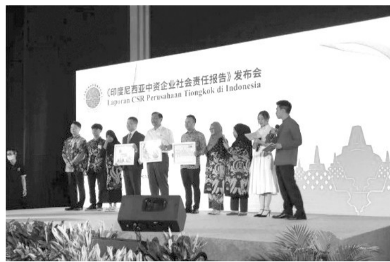
卢虎表扬中企进行了技术转让

艾科说:“我们将持续不断地举行如上述的讨论会,直至完成迁都的过程,并希望能提供战略性的研究指导。”(Ing)