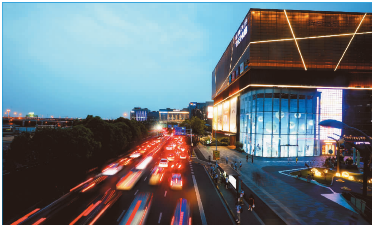
虹桥国际中央商务区

大会展品牌形象日益凸显。“办展会，来虹桥”成为许多企业的一致想法。办展的企业多了，展会能否办得好？