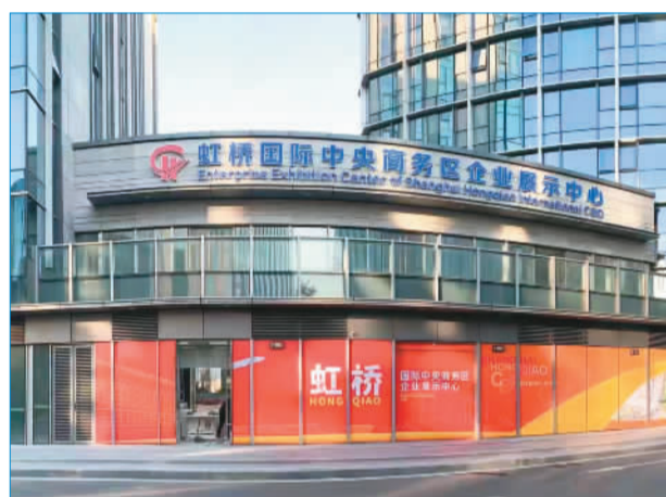
虹桥国际中央商务区企业展示中心