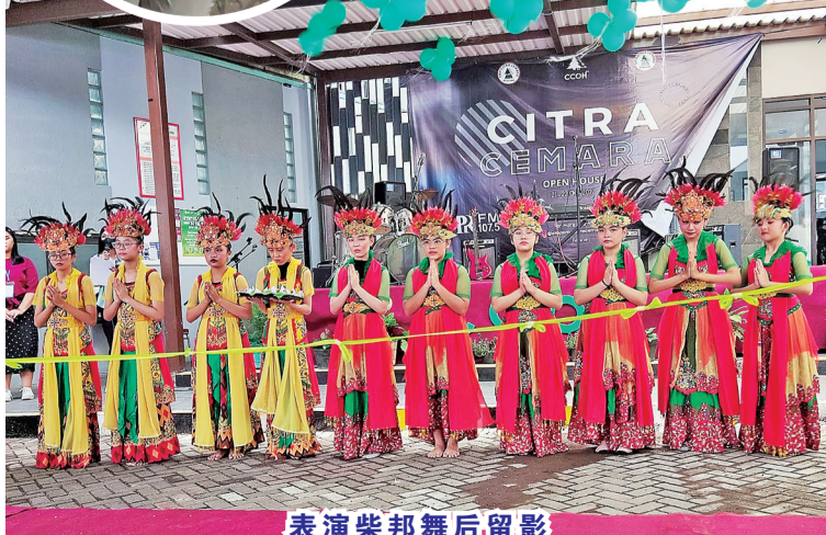
表演柴邦舞后留影

活动展现给民众,学生家长,让大家对“苏哈大街”22号的劲松三语学校有进一步的认识。(本报记者幸一舟报道)