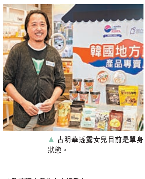
▲ 古明華透露女兒目前是單身狀態。