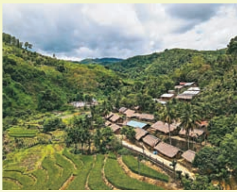
◆海南五指山市初保村。