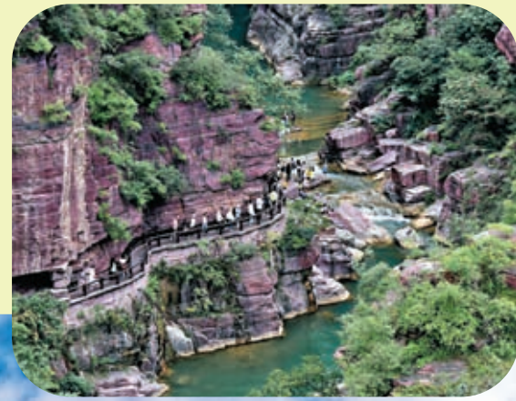
◆遊客在河南雲台山紅石峽景點遊覽。