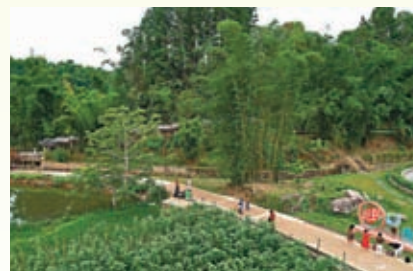
◆遊客在五指山市水滿鄉毛納村遊覽。

而且，五指山亦位於海南省中部生態核心區，熱帶植被類型多，雨林群落典型，有野生維管束植物2,000餘種、陸棲脊椎野生動物300餘種，是海南熱帶雨林國家公園的核心組成部分，生物多樣性極為豐富。同時，位於海南省五指山深處，是黎族傳統村落，村內房屋多以茅草鋪頂，木板作為牆體，形似一艘艘倒扣的木船，故稱為「船形屋」。例如，初保村內，「船形屋」順山勢而建，自上而下呈階梯狀分布，記錄着黎族傳統民居演變的軌跡。而五指山下的毛納村，在不砍樹、不佔田的前提下，依託五指山的優美風光和宜人氣候，大力發展鄉村旅遊業和茶葉特色產業，促進鄉村振興和村民持續增收。