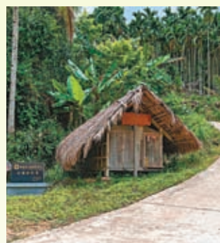
◆五指山深處的黎族傳統民居。