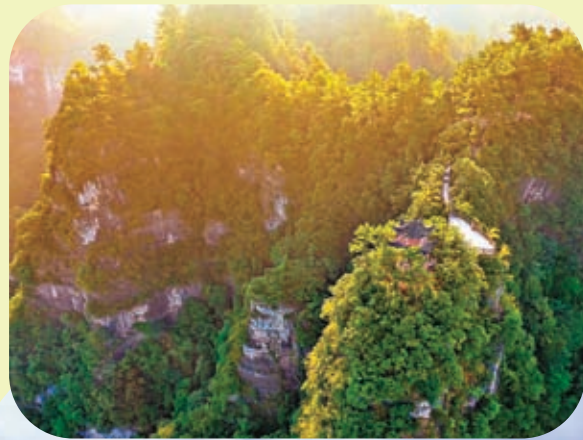
◆朝陽照在貴州施秉雲台山山林間。

中國是個多山的國家，名山眾多，有些山巍峨壯觀、氣象萬千；有些山旖旎秀麗、千姿百態；還有些山與宗教、文化融為一體。這些著名的山岳，引來人們競相攀登遊覽。而且，在中國成千上萬的山脈中，有許多山脈又有極其重要的作用，山地延伸成脈狀即為山脈，山脈構成中國地理、中國地形和中國地勢的骨架，常常是不同地區的分界，山脈延伸的方向稱作走向。加上，現在還有不少山峰打造成風景區，集合各種人文自然特色，景色各異，引人入勝，在現時做好疫情常態化防控的前提下，積極推進旅遊產業復甦。