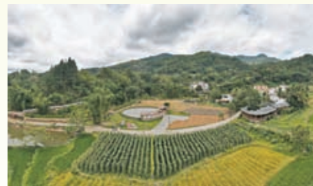
◆五指山市的毛納村景色。