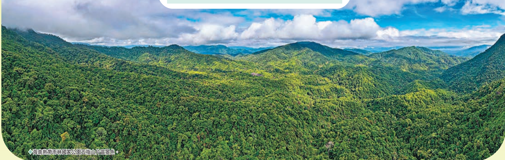
◆海南熱帶雨林國家公園五指山片區景色。