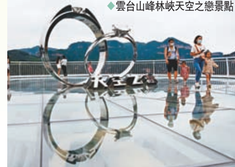
◆雲台山峰林峽天空之戀景點