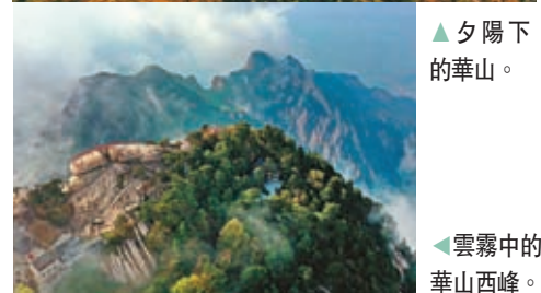
▲雲霧中的華山西峰。