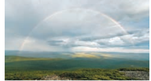
◆傍晚在奧克里堆山拍攝的彩虹。

位於內蒙古自治區呼倫貝爾市根河市的奧克里堆山是大興安嶺北部的一座高峰，清晨與黃昏，奧克里堆山景色各異，引人入勝。奧克里堆山別名鮮卑山，是中國下雪時間最早、融化最晚的死火山，因發現了古冰川遺蹟而聞名。整座山峰植被呈階梯狀分布，主要植物群落類型有綠苔—水蘚—興安落葉松林、柴樺—興安落葉松林、沿岸—興安落葉松、甜楊鑽天柳林、柴樺灌叢、小葉草甸、苔草沼澤。