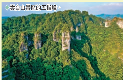
◆雲台山景區的五指峰。