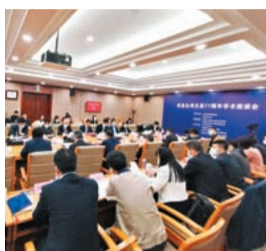
◆10月25日在北京舉行的「堅持『九二共識』推進和平發展」——紀念台灣光復77周年學術座談會現場。

馬曉光指出，兩岸同胞都是中國人，台灣同胞是我們的骨肉兄弟，沒有人比我們更願意也更真心實意地看到兩岸和平統一。但是，樹欲靜而風不止，當前台海局勢緊張動盪，未來何去何從只在民進黨當局一念之間。