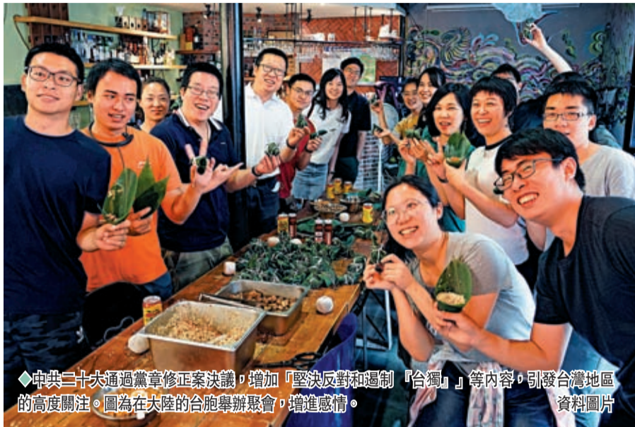
◆中共二十大通過黨章修正案決議，增加「堅決反對和遏制『台獨』」等內容，引發台灣地區的高度關注。圖為在大陸的台胞舉辦聚會，增進感情。資料圖片