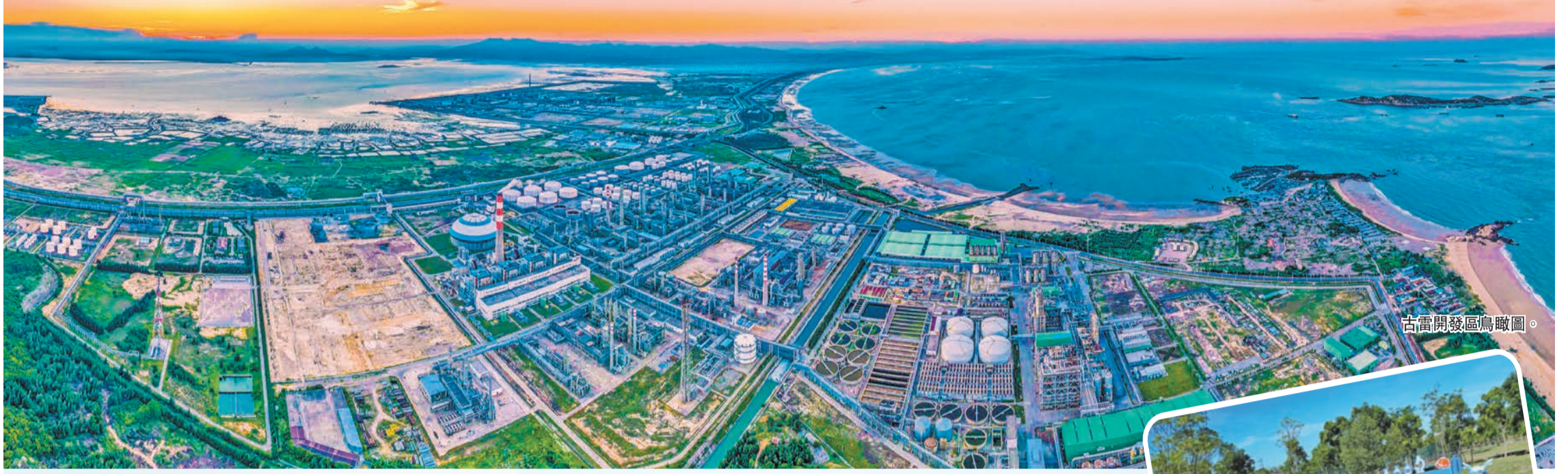
古雷開發區鳥瞰圖。