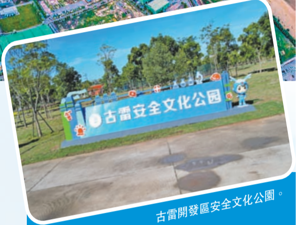
古雷開發區安全文化公園。

十年，在漫漫歷史長河只是彈指一揮間。然而對位於東海之濱的古雷開發區而言，這十年，是一段鳳凰涅槃的難忘歷程。 黨的十八大以來，古雷開發區的變化翻天覆地——從東南沿海農村地帶起步，到建設投資超百億元古雷石化啟動項目、進入國家石化產業戰略布局，再向千億級石化產業、世界一流綠色生態石化基地挺進。十年筆路藍縷、十年激情跨越，4.2萬名群眾騰地讓海，實現整島搬遷，20多萬幹部群眾勳力同