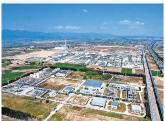
古雷開發區精細化工園區。