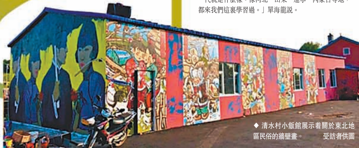
◆ 清水村小飯館展示着關於東北地區民俗的牆壁畫。

「平時遊客多的時候我就賣點土產，山野菜、小米、溜達雞之類的，既不耽誤農活，還能賺些外快，節假日的時候，平均每天去掉成本能淨賺300元左右呢。」村民高興地告訴香港文匯報記者。