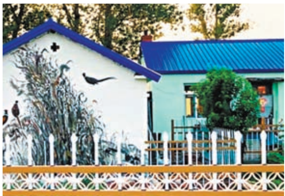
▲ 養雞戶牆壁上畫着栩栩如生的野雞。