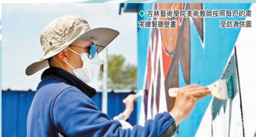
◆ 吉林藝術學院美術教師按照每戶的需求繪製牆壁畫。

「大姑娘叼着煙袋，抱着孩子餵酸菜，鹿茸角聲名在外，畫在牆上美起來。」一幅幅生動的壁畫，生動地對外展示了東北地區的古老民俗，還有那些畫在牆上的夢想與故事，這些繪畫讓清水村成為了有名的「塗鴉村」。