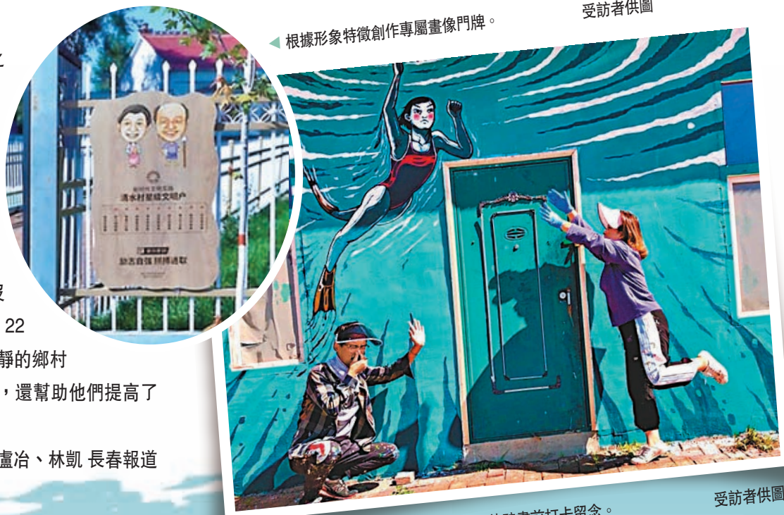
◆ 根據形象特徵創作專屬畫像門牌。