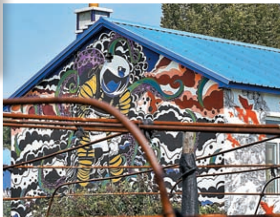
◆ 牆畫上展示着家中高中生的航天夢。