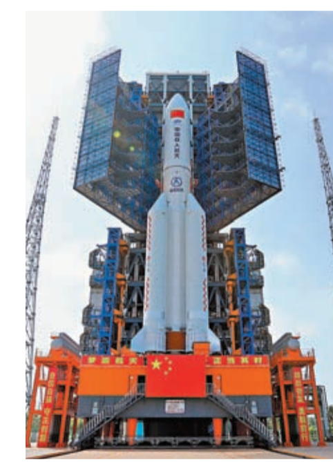
◆10月25日，夢天實驗艙與長征五號B遙四運載火箭組合體轉運至發射塔架。

香港文匯報訊 據中新社報道，據中國航天工程辦公室消息，夢天實驗艙與長征五號B遙四運載火箭組合體25日已轉運至發射區，後續將按計劃開展發射前各項功能檢查和聯合測試等工作，計劃於近日擇機實施發射。垂直轉運工作是從當天早上8:10分開工的。夢天實驗艙和長征五號B遙四運載火箭組合體從垂直測試廠房出發，在活動平台的托舉之下，沿着這條近3公里長的專用軌道，穩穩地向發射塔架前進，經過2個多小時的垂直轉運