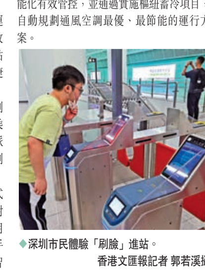
◆深圳市民體驗「刷臉」進站。

香港文匯報訊(記者 郭若溪 深圳報道) 深圳地鐵14號線計劃本月底開通初期運營。近日，深圳地鐵舉行首場「新線開放日」活動，記者試乘新線列車，探營新站點，搶先體驗深圳首條「東部快線」的便捷出行。據了解，14號線將在開通後上線「刷臉」進站功能，乘客只需將實體票卡、乘車碼，在固定設備通過人臉識別或掌靜脈識別相互綁定，即可搭乘14號線時「刷臉」進站。為配合無人駕駛技術，14號線引入了板式無砟軌道，在一定程度上降低了地鐵施工對周邊環境的污染。此外，地鐵14號線採用智能環控系統運用信息技術和通信技術手段，對地鐵照明燈具、通風空調系統做出智