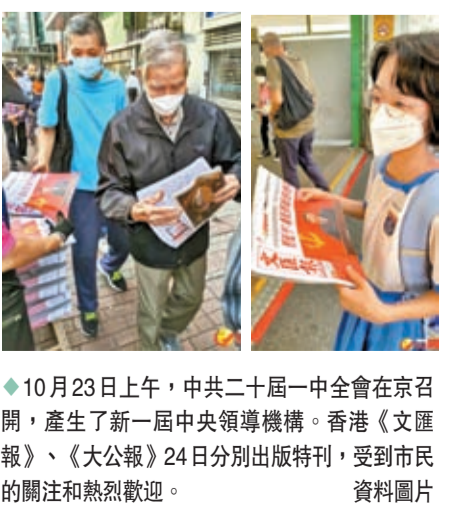
◆10月23日上午，中共二十屆一中全會在京召開，產生了新一屆中央領導機構。香港《文匯報》、《大公報》24日分別出版特刊，受到市民的關注和熱烈歡迎。