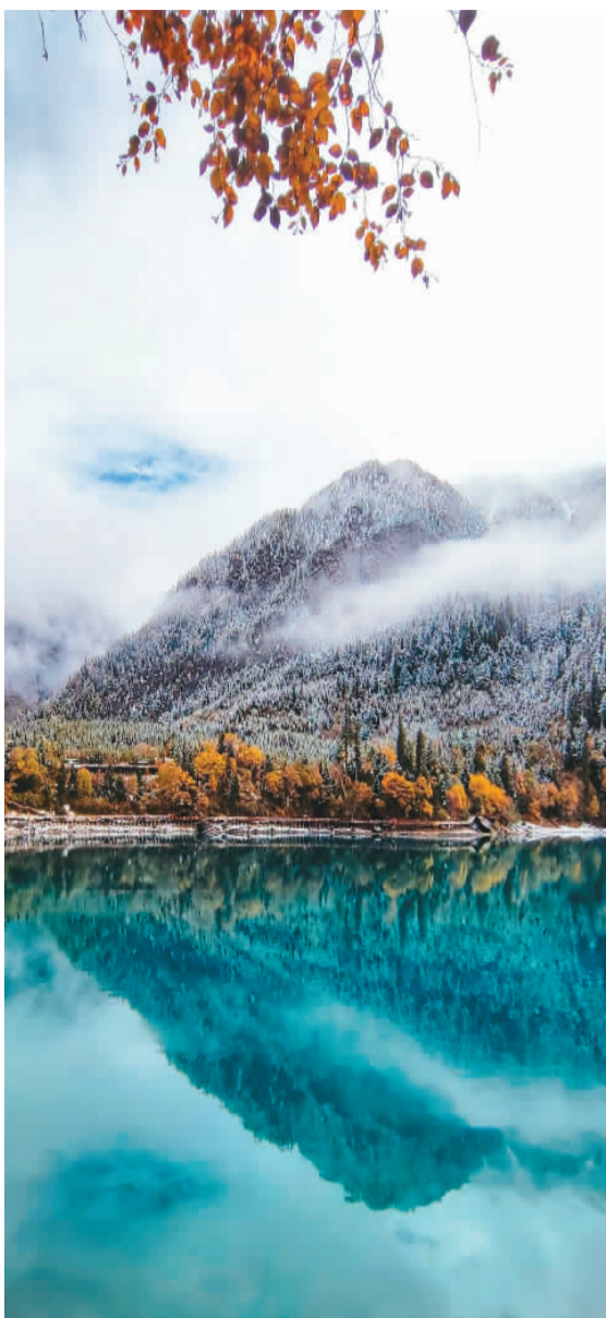
▼ 进入十月，四川省九寨沟迎来一年中最多彩的季节。图为近日，九寨沟景区内多处景点降下今秋第一场雪，美丽景色宛若童话世界。