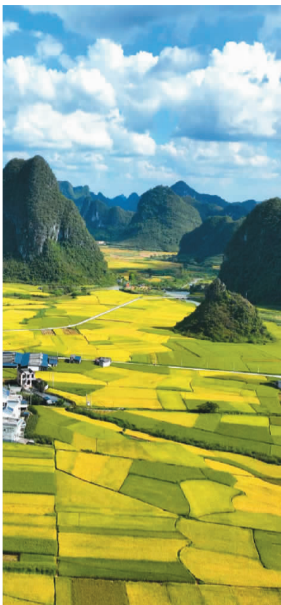
▲ 金秋时节，地处祖国西南边陲的广西壮族自治区靖西市单季晚水稻陆续进入成熟收割期，金黄的稻田为大地披上一层金装。图为靖西市化峒镇三友村稻田航拍图。