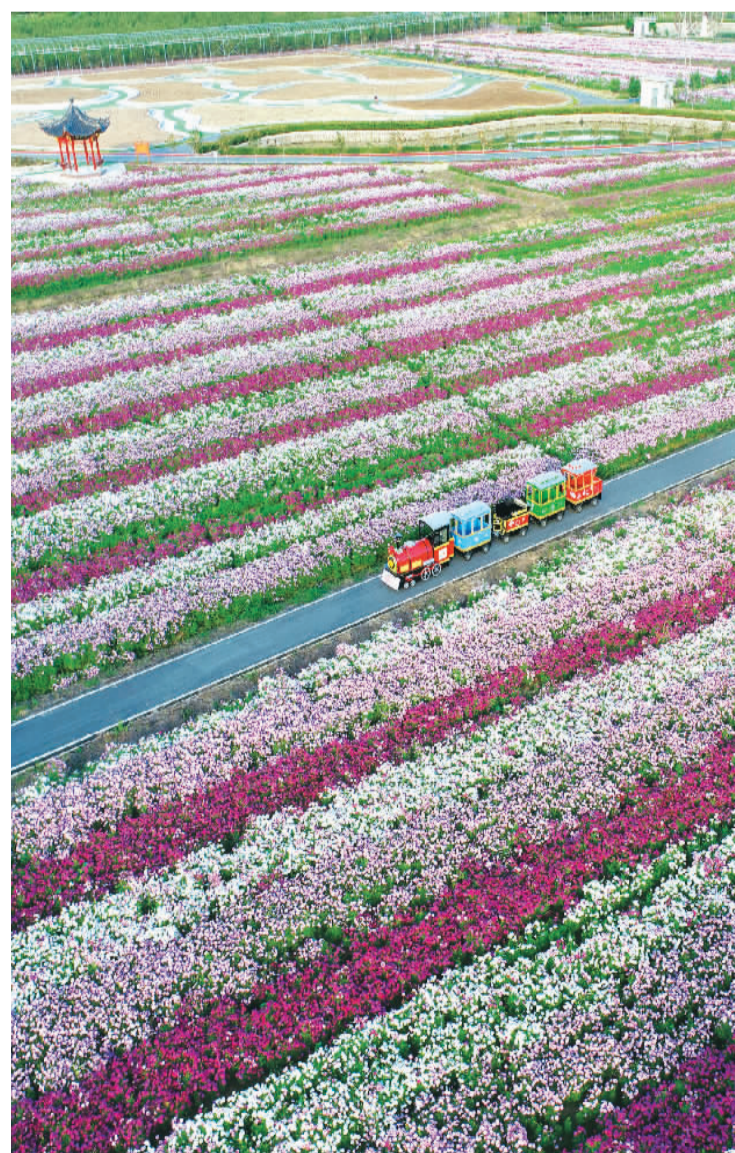
▲ 在浙江省东阳市南马镇花园村现代农业生态园里，一辆小火车穿梭在五彩波斯菊海中，呈现出一幅美丽乡村生态画卷。