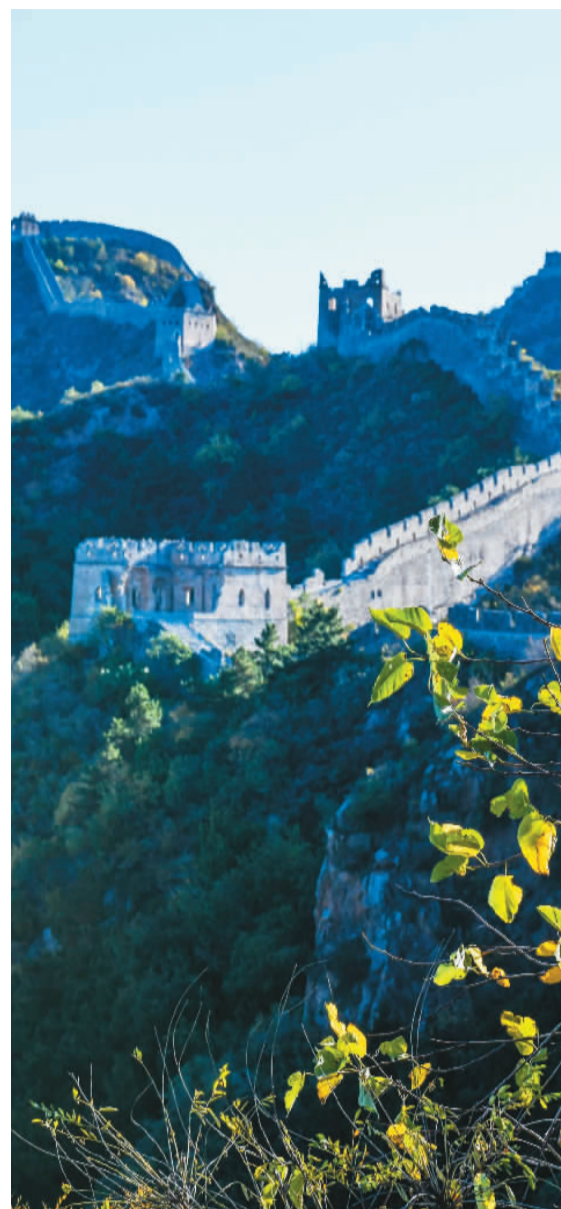
▼ 神州大地秋景如画，尽显大美中国山河锦绣。图为在河北省承德市滦平县境内拍摄的金山岭长城景区秋景。