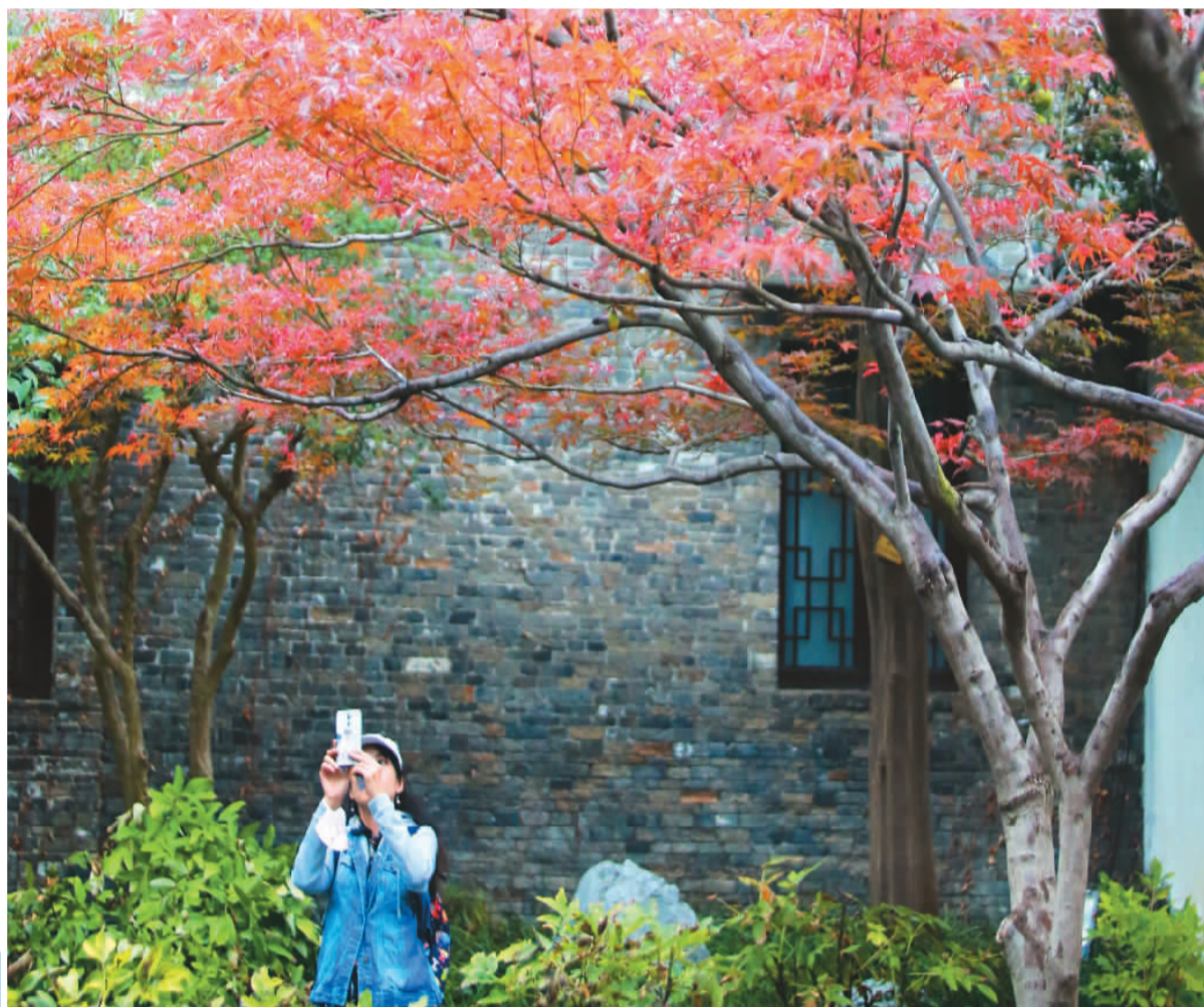
▲ 江苏省扬州市何园景区的枫叶渐红，随风摇曳，吸引了游客前来观赏。图为一名游客在何园景区赏枫拍照。

金秋十月，神州大地披上了五彩斑斓的衣裳。广大农村进入秋熟作物收获的季节，一年的辛勤耕耘结出硕果，满地金黄；山野间，层林尽染，秋韵浓郁，人们在秋高气爽中乐享美好时光…… “一年好景君须记，最是橙黄橘绿时。”今天，让我们一同走进锦绣山河，感受大美中国。