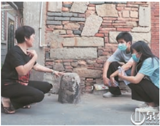
好客的西街人講述西街故事

“大名鼎鼎的西街，肯定是去泉州的第一站啊。” “為什麼大家都說西街很好玩，真的嗎？” “跑這麼遠來看西街，怎麼讓這趟旅遊更值得呢？”