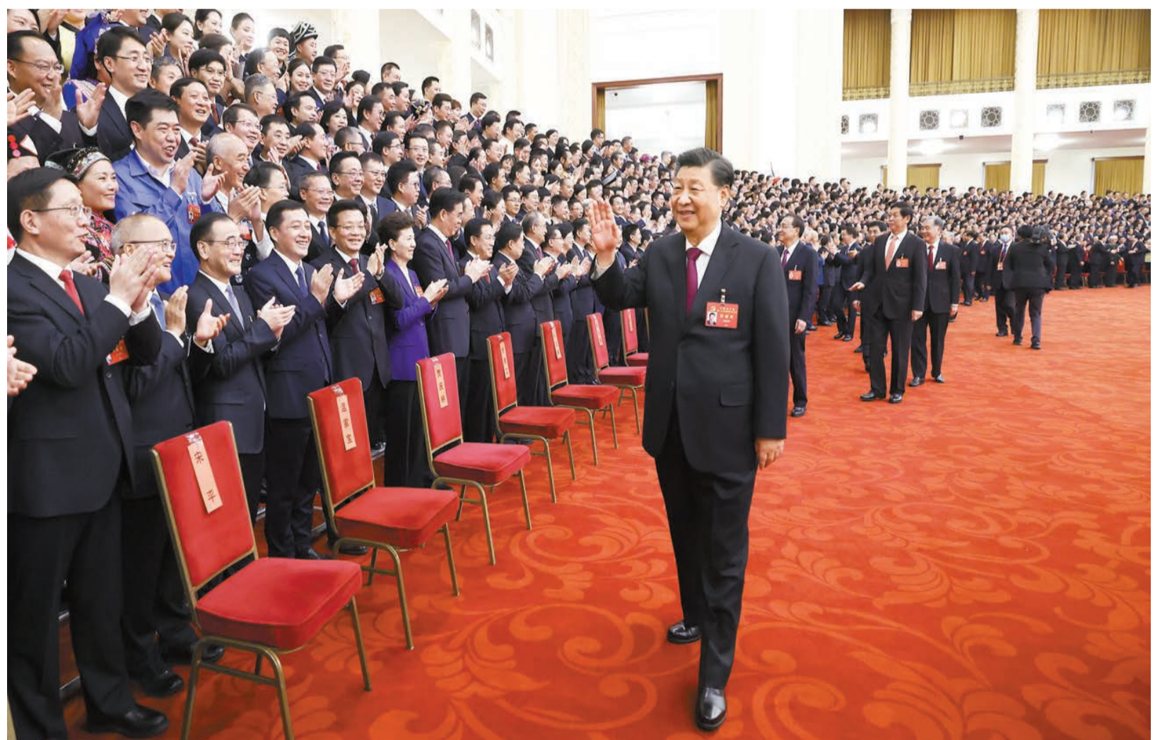
昨天下午，中共中央總書記、國家主席、中央軍委主席習近平會見黨的二十大代表。新華社

【香港商報訊】據新華社報道，中共中央總書記、國家主席、中央軍委主席習近平23日下午在人民大會堂親切會見了出席黨的二十大代表、特邀代表和列席人員，並同大家合影留念。