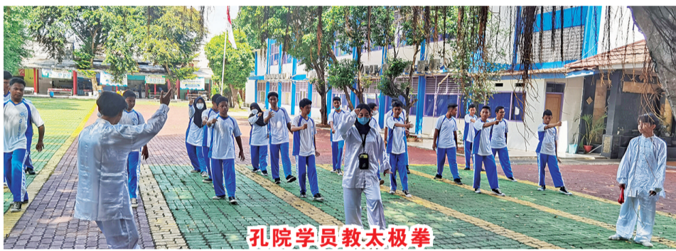
孔院学员教太极拳

阿拉扎孔院始终立足汉语教学与文化交流,努力促进本土汉语教师水平提升和协助中学增加高中生学习汉语的兴趣,不断发挥作为综合性文化、教育交流平台的作用。