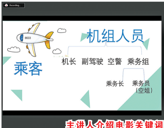
主讲人介绍电影关键词