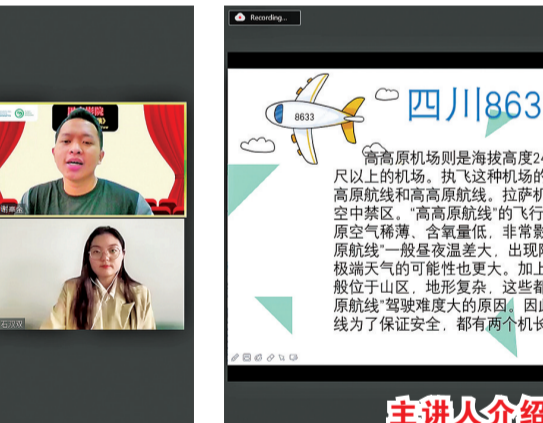
主讲人介绍电影故事发生背景