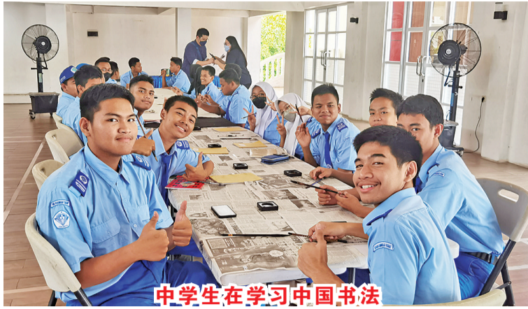
中学生在学中国书法