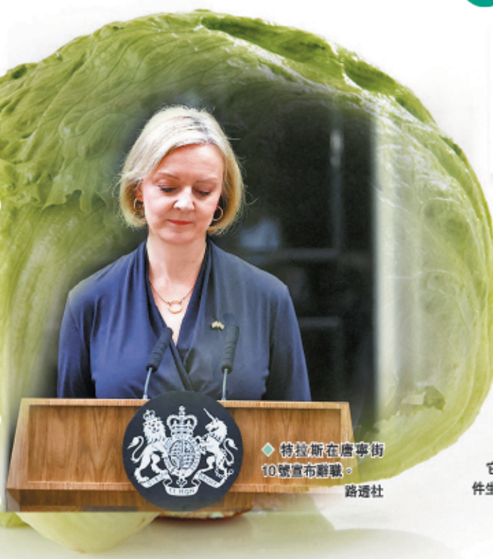
特拉斯在唐寧街10號宣布辭職。

管治威信蕩然無存的英國首相特拉斯，20日終於宣布辭職，以短短45天的任期，成為英國300年憲政史上最「短命」的首相。保守黨黨團「1922委員會」主席布雷迪之後宣布將於10月28日前選出新黨魁，多名保守黨人隨即放風有意參與角逐，包括9月才剛剛下台的前首相約翰遜，以及前財相蘇納克。不過分析估計「山頭林立」的保守黨很難在短期內一致推舉出繼任首相，在野黨派要求立即提前大選的呼聲已經甚囂塵上。