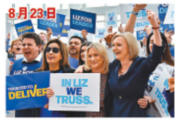
8月23日，當時為外相的特拉斯出席造勢活動。

特拉斯是英國300年憲政史上最短命的一任首相，比之前的紀錄保持者坎寧的任期足足短了74天。即使與世界其他「短命」領導人相比，特拉斯任期之短也可以說是近代史上頭幾名。