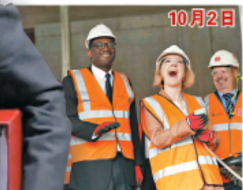
10月2日，特拉斯10月2日與時任財相考騰到訪一個工程地盤。