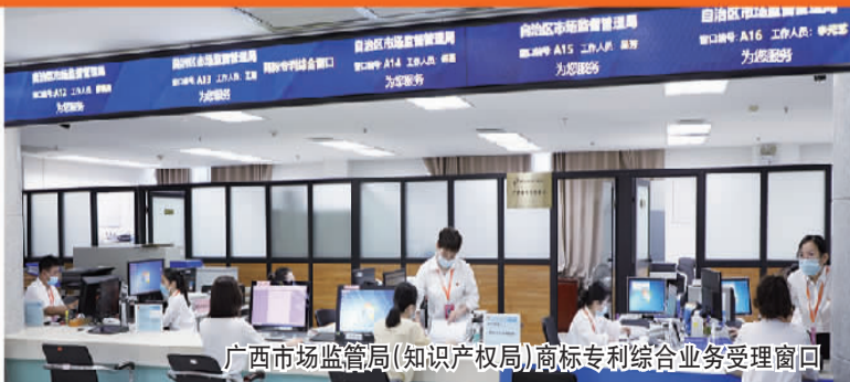
广西市场监管局(知识产权局)商标专利综合业务受理窗口