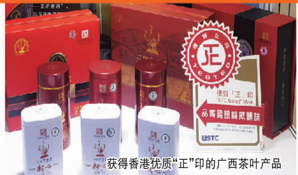
获得香港优质“正印”的广西茶叶产品