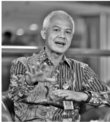
中爪哇省长甘贾尔甘贾尔