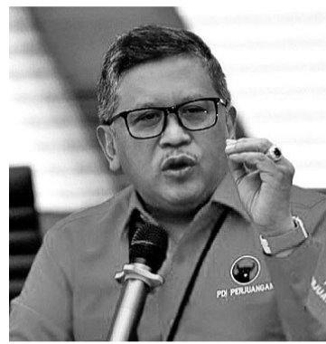
印尼斗争民主党秘书长哈斯托