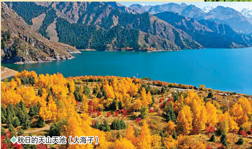
◆秋日的天山天池（大海子）

在新疆人眼裏，天山是有神性的山，海拔5,445米的博格達峰，是天山山脈東段的最高峰。天山天池在博格達峰的半山腰，被四周的群山環抱，是由第四紀冰川消退形成冰磧堤堵塞冰川谷而成的天然湖泊。冰磧湖在我國並不罕見，但像新疆天山天池這般美的冰磧湖就屈指可數了。這裏四季景色俱佳，古往今來，文人墨客多吟詩賦文，備極讚賞。邱處機、紀曉嵐、郭沫若、金庸等都曾登臨此地，一覽「瑤池仙境」、「天山明珠」之勝景。