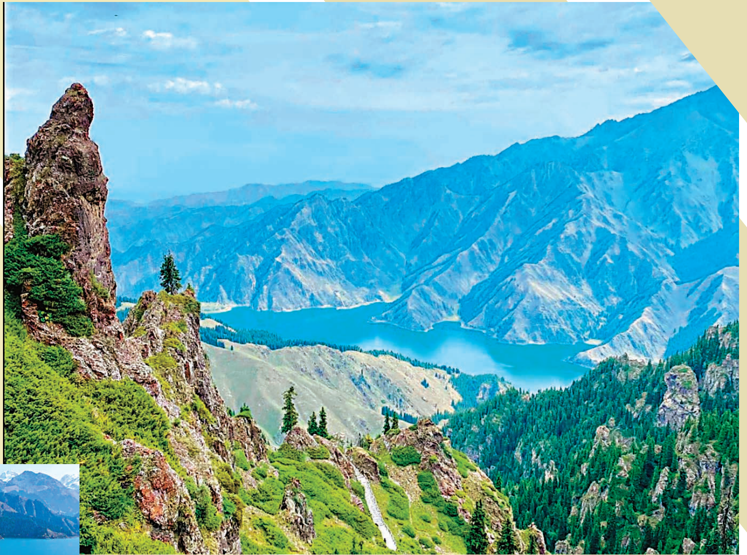
◆在馬牙山俯瞰天山天池

作為聯合國教科文組織世界遺產的一部分，天山天池風景名勝區隨着海拔高度不同，擁有冰川積雪帶、高山亞高山帶、山地針葉林帶和低山帶四個完整的自然景觀。其中，天山天池北岸的白楊溝是天池景區生物多樣性最為豐富的地區。金秋時節，混雜在雲杉純林中的樺樹和各種灌木，以及河谷中的山楊、密葉楊等都隨着季節的更迭而變幻着顏色，唯有雪嶺雲杉其中，不得不讚嘆大自然的鬼斧神工成就了這壯美異常的人間天堂。