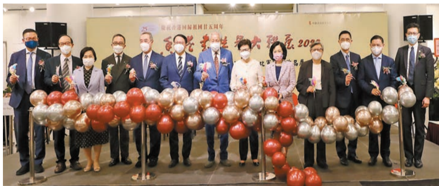
香港書法界大聯展昨日舉行開幕儀式。

展覽展出中國書法家協會和廣東省書法家協會送來的展品，包括了多位中、青年協會理事的書作。他們有的是省、市級書法家協會的佼佼者，有全國大展的獲獎者，亦有來自藝術系的專業老師，各人雖書風各