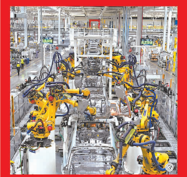
图①：2022年9月7日，河北雄安新区商务服务中心农景。图②：2022年10月17日，新疆维吾尔自治区昌吉回族自治州玛纳斯县三十里店镇新兴产业园区内，工人正开足马力，赶制订单。图③：2022年10月11日，陕西省商洛市洛南县旱稻水稻种植示范园培育种植的水稻开始收割。图为村民在水稻开镰仪式上庆祝丰收。图④：2022年10月11日，浙江省玉环市清港镇青山村海涂华能100兆瓦“渔光互补”光伏发电站，单晶硅光伏板与晚霞交相辉映。图⑤：2022年9月26日，重庆市沙坪坝区青凤高科产业园区内，自动化焊接机器人正在焊接新能源汽车车身。