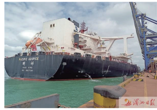
圖為10月8日，“明祥”輪在羅嶼港口靠泊接卸。

羅嶼港口是我國東南沿海最大的礦石碼頭，通過集鐵路、公路、水水中轉於一體的綜合集疏運體系，輻射範圍可覆蓋福建省、江西、湖南、湖北、長江中下游區域、中國臺灣，以及日本、韓國等。隨著40萬噸級船舶靠泊的常態化，羅嶼港口持續深化與淡水河谷的多樣合作，共同構建鐵礦石原礦和混配礦產品在羅嶼港口直接發運的新模式等，強化港口競爭力，全力打造國際一流散貨港口。（湄洲日報記者 鄭已東）