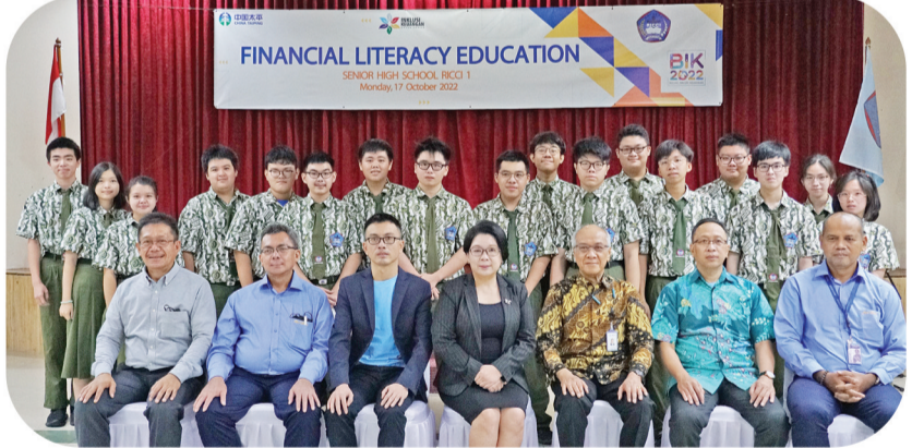
中国太平保险印度尼西亚有限公司领导与校方及学生合影