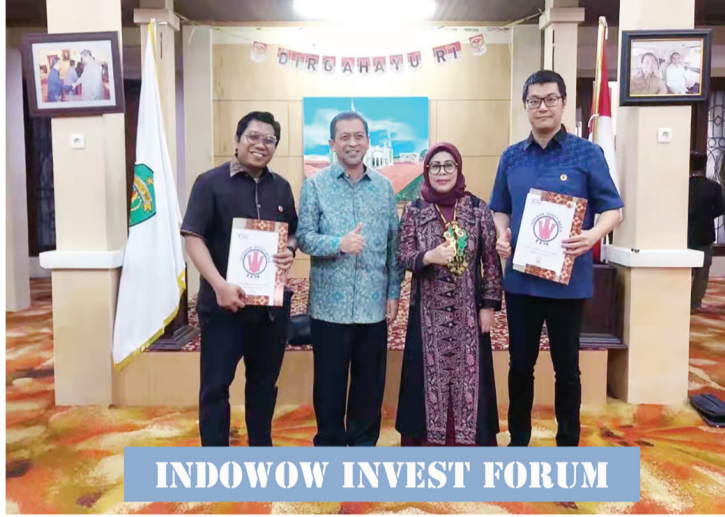
INDOWOW INVEST FORUM