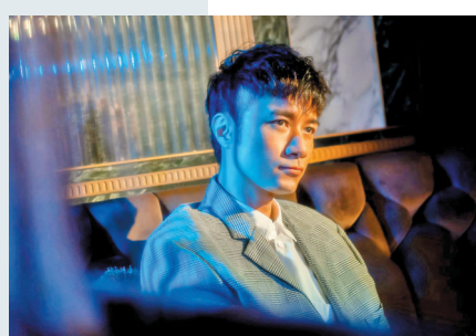
◆古巨基在新歌MV中變身唱片公司總經理。