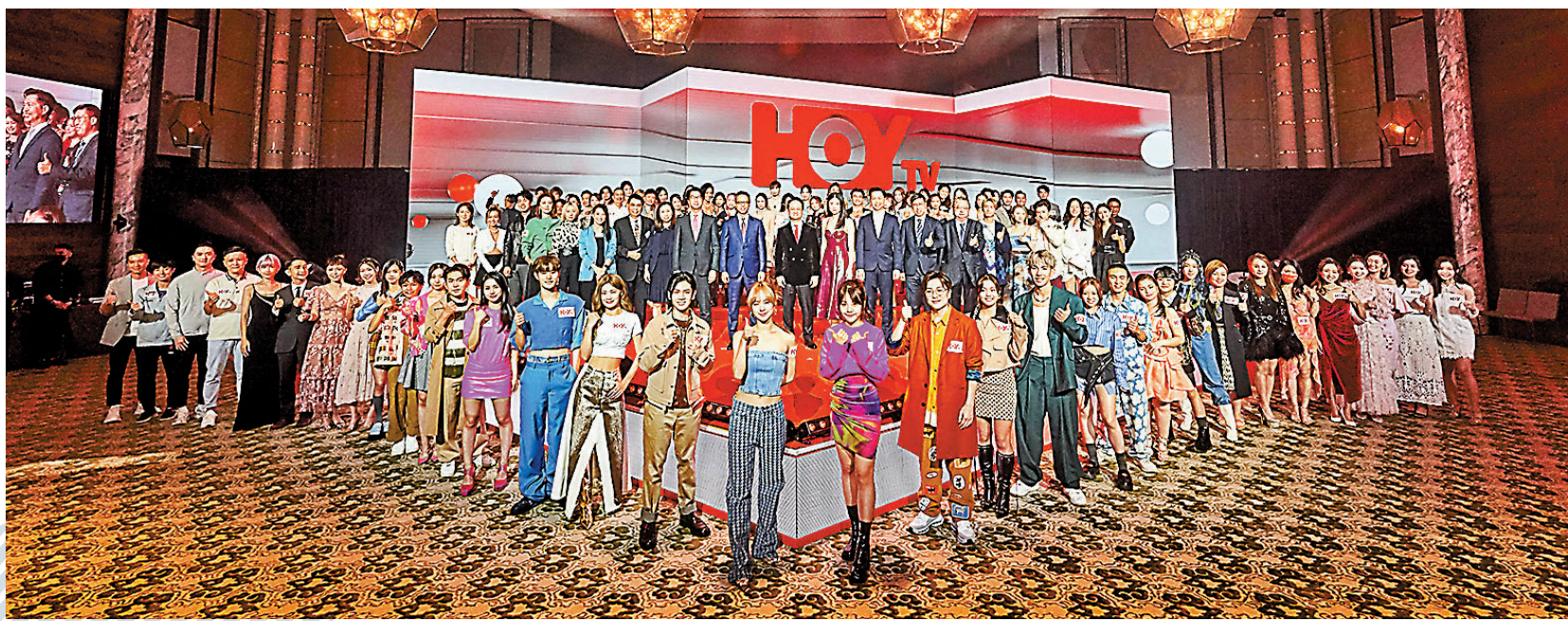
◆眾主禮嘉賓與出席藝人大合照。

香港文匯報訊 (記者 阿祖) 香港開電視 (免費電視 77 台) 昨日舉行「全面進化 重新啟航」活動，公布正式採用全新台名及台徽「HOY TV」，向嘉賓及觀眾推介全新節目。活動上邀請到政務司司長陳國基、有線寬頻通訊副主席兼執行董事曾安業及藝人陳慧琳等擔任主禮嘉賓主持啟動儀式；現場亦有近百位藝人支持並於台上推介全新節目，包括周勵淇、陳柏宇、泳兒、衛詩雅、湯怡、鄭融、簡淑兒、余思敏等。