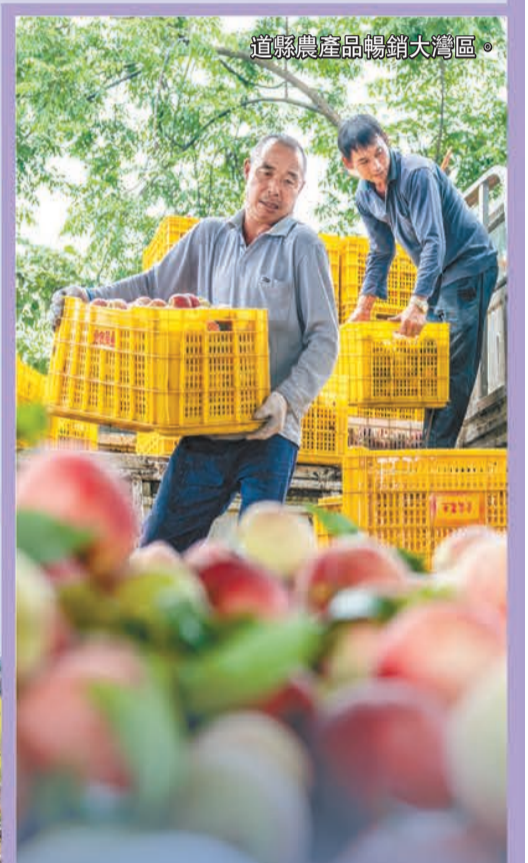
道縣農產品暢銷大灣區。

縣城規模變大了，街道變寬了、城區變綠了、夜景變亮了、環境變美了。自然與人文在這裏交織，山與水在這裏交融，歷史與未來在這裏交響，古老的道縣煥發了新的活力。