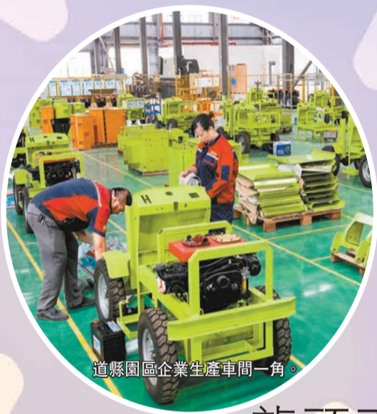
道縣園區企業生產車間一角。

一組組不斷刷新的數據，如同一串串跳躍的音符，譜寫了道縣科學趕超的華彩樂章，奏響了跨越發展的動人凱歌。