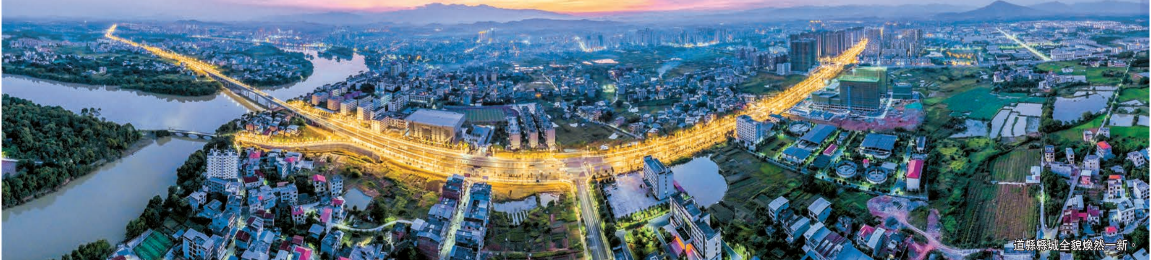
道縣縣城全貌煥然一新。