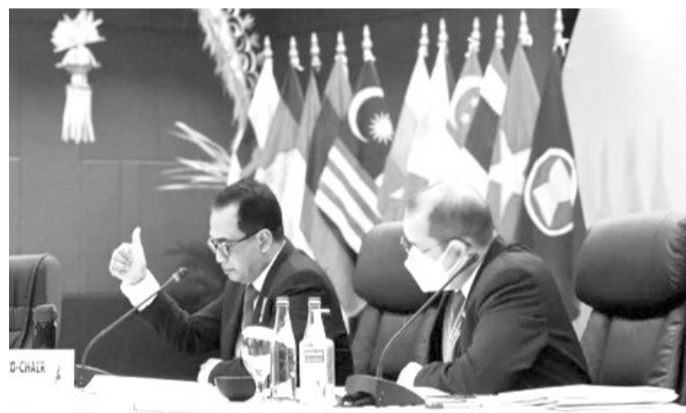
交通部长苏马迪 (Budi Karya Sumadi) 在巴厘举行的第28届东盟交通部长会议上,我国邀请韩国推动雅加达第四阶段地铁发展。

因为中小微企业要争取融资大量生产国内商品。除了财政和货币政策之外,政府也推动金融领域的政策,使金融体系的监管能创造一个健全的中介,同时也要推动数字经济、绿色经济和印尼经济可持续性的发展。 (Sm)