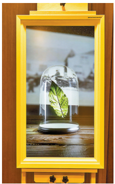
◆新科技下的 NFT 藝術藏品。