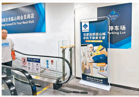
▲ 傳統商超將「極速達」標誌貼在醒目處。