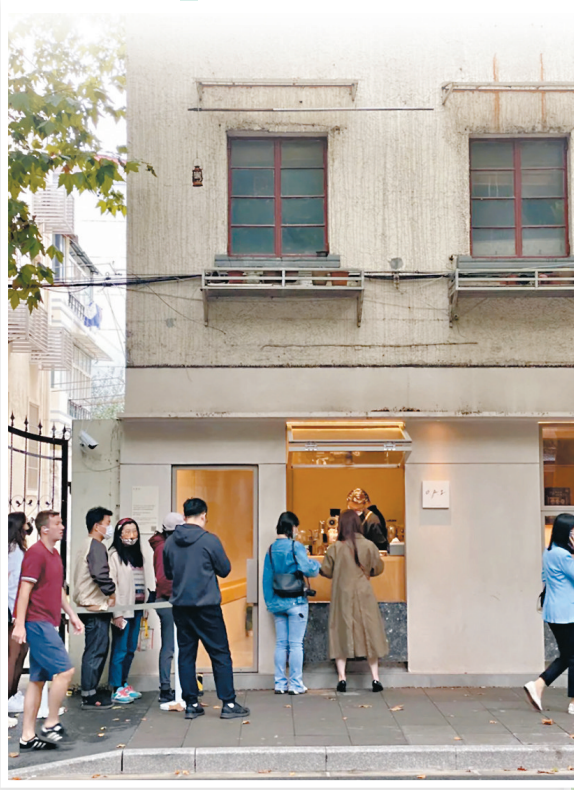
◀ 在上海的小馬路上，只有一個窗口的特色小店也吸引人們排隊購買。

記者在山姆、盒馬等超市看到，國慶節期間的人流並不算多，結賬處、試吃處等傳統需要排隊的地方幾乎不需排隊，商家在入口、出口等地用醒目的海報宣傳送貨上門極速達。不同於傳統電商的「一處貨源供全國」，高度依賴本地化供給是「即時零售」供給端特點之一。受益於此，包括傳統商超、便利店在內的本地實體零售業態，正在大規模無縫融入零售線上化進程之中，成為疫後中國零售市場發展的新業態。