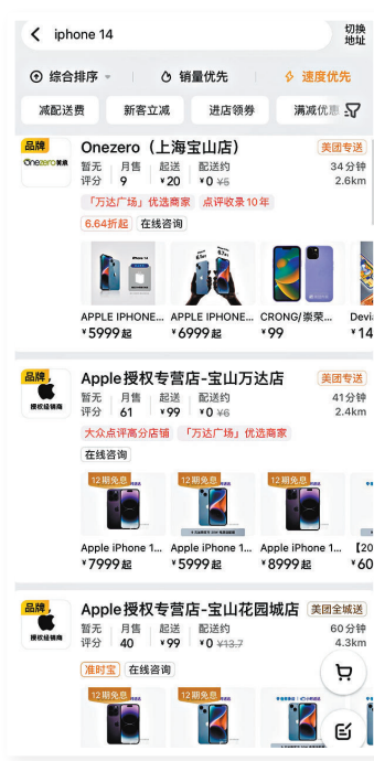
▲ 外賣平台上顯示 iPhone 14 可以「即時零售」。手機截圖