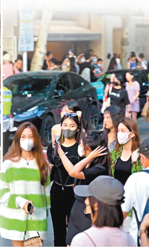
▲ 上海安福路遊人如織。

「現在有『即時零售』就方便多了，我把店開在商場地下室也沒問題，只要消費者能在平台上搜索到我們，我們就可以賣貨。」這家店裏堆滿了瓜子、花生、板栗等應季產品，還有熱氣騰騰的手搖爆米花，雖然店舖開在不起眼的地方，但得以在網絡上曝光，店舖內生意紅火，外賣自動接單機不時提示「你有新的訂單」並吐出一串串的小票。「我們賣的糖炒栗子、爆米花，送到消費者手裏都是熱乎乎的，附近的居民送過去最快幾分鐘就到了。」