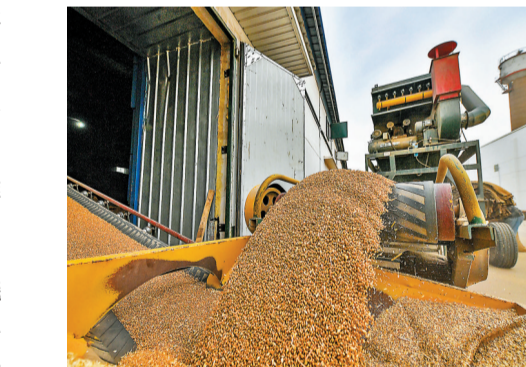
◆在中央儲糧庫天津東麗直屬庫，小麥被傳送帶轉運至倉房內。新華社