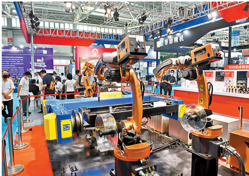
◆中國三季度經濟明顯回升。能源裝備、石化裝備、礦山機械、工程機械、數控機床、工業機械人等重點項目訂單都在大幅增長。圖為參觀者在青島國際博覽中心參加第25屆青島國際機床展覽會。新華社

趙辰昕直言，一段時間以來，經濟全球化遭遇「逆風逆流」，一些國家想實行「脫鉤斷鏈」、構築所謂的「小院高牆」，但世界決不會退回到相互封閉、彼此分割的狀態，開放合作仍是歷史潮流，互利共贏依然是人心所向。