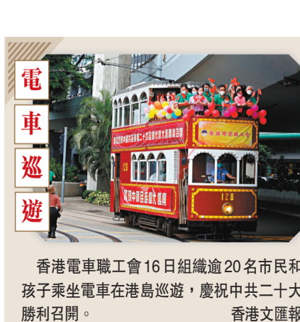
香港電車職工會16日組織逾20名市民和孩子乘坐電車在港島巡遊，慶祝中共二十大勝利召開。