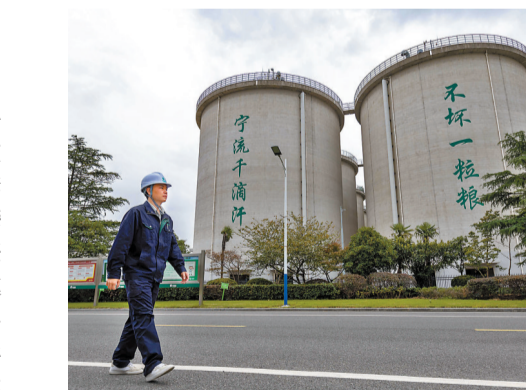
◆董亮表示，要通過五個方面舉措保障我國糧食等重要農產品有效供給。圖為工作人員在中央儲糧庫上海直屬庫巡查。新華社

香港文匯報訊 綜合中新社、新華社報道，中國國家發展改革委黨組成員、副主任趙辰昕17日在北京透露，中國人均糧食產量達到483.5公斤。即使不考慮進口補充和充裕的庫存，僅人均糧食產量就已超過國際上公認的「400公斤」糧食安全線。