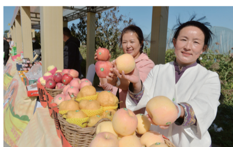
【青島豐收節上,農民展示碩果累累。】