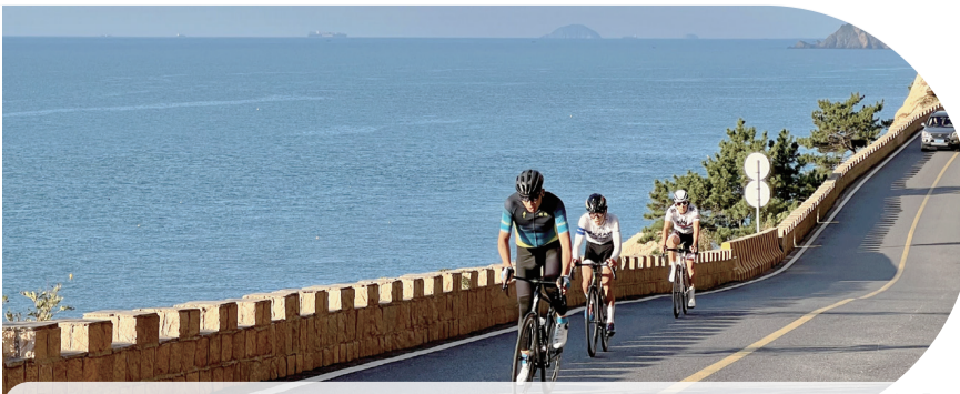
【在騎行中感受青島山海之美。】