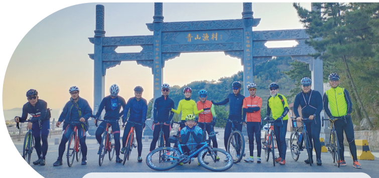
【騎行成為青島健身圈新晉“網紅”。】

而為推動自行車運動發展,青島現已着手對曾是2019世界休閒體育大會自行車比賽場地的青島萊西湖環湖路進行提升。工程竣工後,一條全長31公里的騎行公路,將串聯起藝術油畫、遺址文化、自然生活、水庫文化四大主題特色小鎮,形成一條連接文化與娛樂休閒的生態長廊。(張羽)