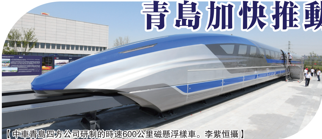
【中車青島四方公司研制的時速600公里磁懸浮樣車。】