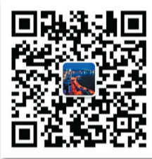
青島發佈 官方微信二維碼