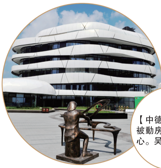
【中德生態園內的被動房技術體驗中心。吳帥攝】