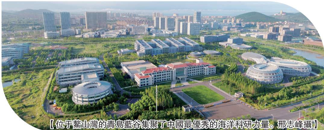
【位於嶗山灣的青島藍谷集聚了中國最優秀的海洋科研力量。邢志峰攝】

《青島市打造國際化創新型城市五年規劃(2022-2026年)》和《三年行動方案(2022-2024年)》日前發布。規劃提出,未來五年,青島將努力建成具有全球