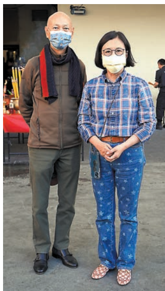
◆汪明荃和丈夫羅家英有份參與演出。