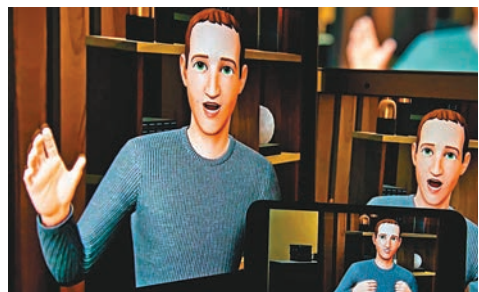
◆Horizon Worlds 的圖像設計被指水平低劣。網上圖片