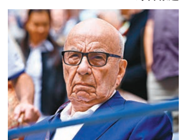
◆梅鐸打算將霍士公司和新聞集團再度合併。資料圖片