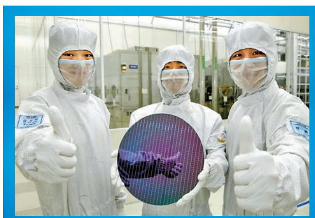
◆韓國三星電子生產的半導體被指侵犯 Daedalus Prime 公司專利。資料圖片