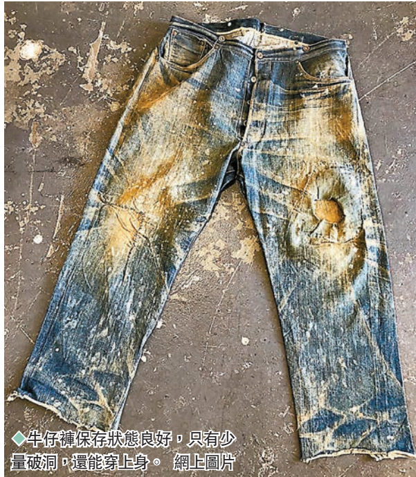
◆牛仔褲保存狀態良好，只有少量破洞，還能穿上身。網上圖片

美國一條有142年歷史的古董 Levi's 牛仔褲日前在拍賣會上以8.7萬美元成交，是歷來最昂貴的牛仔褲之一，但原來這條牛仔褲的歷史價值遠不止此。