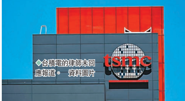
◆台積電的律師未回應報道。