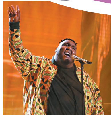
◆ Willie Spence 憑參加《美國偶像》成名。

所以在演細個的時候沒有刻意扮嘢，只在動作方面着手。而到了演40歲時就壓低聲線，舉止放慢一點，就會令大家有驚喜。對於劇情講她與林盛斌一打疑似影射現實富豪的情節，劉佩玥說：「拍的時候大家都沒有這個想法，都開心大家看得很投入，會代入現實中的人物，不過都是那一句：劇情如有雷同，實屬巧合。」至於有觀眾見劉佩玥成長後的角色性格反差很大，懷疑她也是反派之一，她笑道：「似奸是好事，劇中我們三姊妹都會有變化，正如我和陳曉華絕交後如同陌路人，但重遇時其實不應該有仇視的眼光，當中的細節就要留給觀眾去注意。」