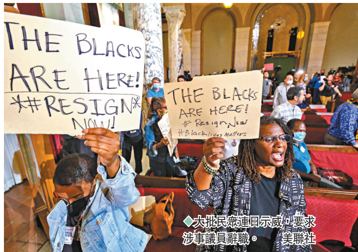
◆大批民眾連日示威，要求涉事議員辭職。美聯社

俄羅斯總統普京12日向國內能源業代表發表演說，指「北溪」管道洩漏事件是「國際恐怖主義行徑」，對美國、波蘭和烏克蘭有利。普京同時批評歐盟擬對俄原油實施價格上限，揚言俄不會向參與的歐洲國家供油，將威脅數十億計民眾的生活。 ◆法新社