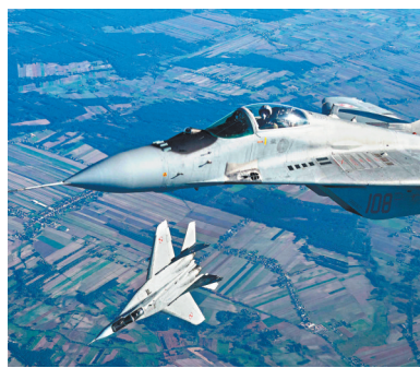
◆演習將有能攜帶核彈頭的戰機參與，但不涉及任何實彈。

北約秘書長斯托爾滕貝格11日宣布，北約將於下周舉行核威懾力量演習，他表示若因俄烏衝突而取消這次計劃已久的演習，將向俄羅斯發出「絕對錯誤的信號」。美聯社指出，北約此舉沒有顧及俄方警告。