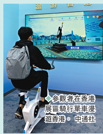
◆參觀者在香港展覽區騎單車漫遊香港。