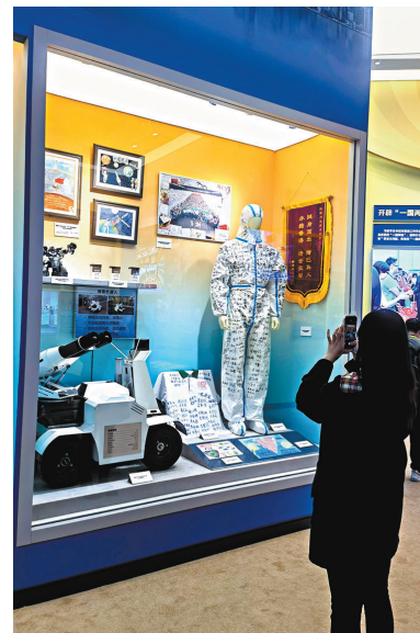
◆展覽展出兩地合作抗疫故事，感動觀眾。香港文匯報記者王珏攝

展廳內，展現港澳與內地手足情誼、眾志成城的內容備受關注。特別是印有內地援港醫療隊所有隊員簽名的防護服，訴說着兩地醫護人員在新冠疫情下共克時艱的真摯情感，感人至深。今年年初香港第五波疫情來勢洶洶，肆虐全港。危急時刻，來自25家廣東三甲醫院、391名有豐富防疫經驗的內地援港醫療隊隊員奔赴香港，全力投入一線的防疫工作之中。經過兩個月與香港同行的攜手奮戰，圓滿完成工作任務，於5月5日離港返回內地休整。香港第五波疫情得到有效控制，亞博館新冠治療中心宣布減燈備用，印有內地援港醫療隊所有隊員簽名的防護服則記錄了這段驚