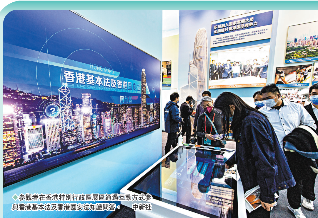
◆參觀者在香港特別行政區展覽區通過互動方式參與香港基本法及香港國安法知識問答。