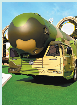
◆東風-41導彈展示。

在「中國天眼」FAST模型前，觀衆排起長隊，等待通過耳機聆聽經過技術處理的來自宇宙深處的脈衝星聲音，模擬「天眼」視覺仰望星空，以「太空」視覺俯瞰地球。