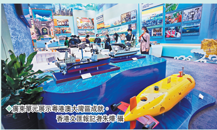
◆廣東單元展示粵港澳大灣區成就。