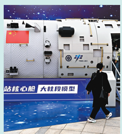
◆參觀者參觀中國太空站核心艙大柱段模型。中新社

帶著高溫灼燒痕跡的神舟十二號返回艙、「奮鬥者」號全海深載人潛水器模型、「祖沖之號」超導量子計算原型機……在一個個科技含量十足的「大國重器」面前，參觀者無不被中國科技的硬實力所震撼。 體現航天成就的元素亮相多個展區。神舟十二號飛船曾搭載黨旗見證了中國載人航天太空站在軌建造階段首次載人飛行任務；長征五號火箭代表了中國運載火箭科技創新的先進水平。