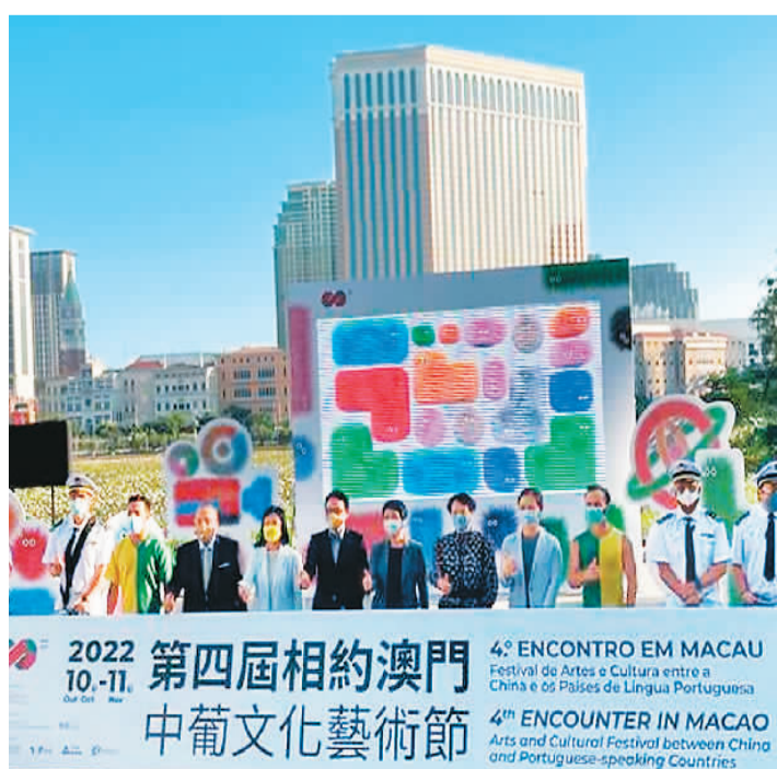
第四届“相约澳门——中葡文化艺术节”活动巡礼现场。

“中国与葡语国家电影展”以“海纳百川”为主题，11月4日至18日向观众呈献约30部中国及葡语国家电影佳作。首次举办的中葡绘本书展将于10月28日起展销500余种以葡文为主的多种语言绘本及儿童书籍。此外，内地和澳门葡语艺术团将携手走访社区，把中国及葡语系国家的表演艺术和文化活力带入城市各个角落。