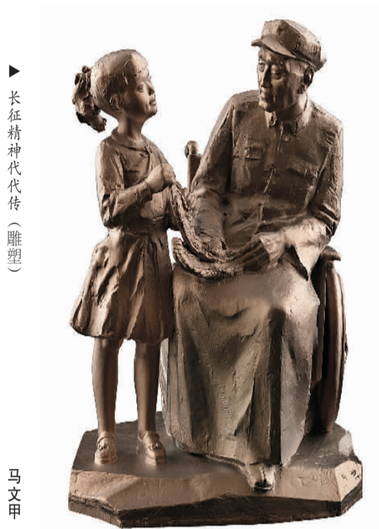
▶ 长征精神代代传（雕塑）