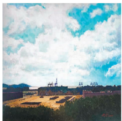
▲ 洋山港新貌（油画） 靳尚谊

画笔描绘时代景观，镜头定格动人瞬间。连日来，展览吸引了众多观众前来观看。北京市民李女士专程带孩子来看展。她说，希望孩子能在图像中了解当下，感受家国情怀，从中汲取奋进向上的力量。