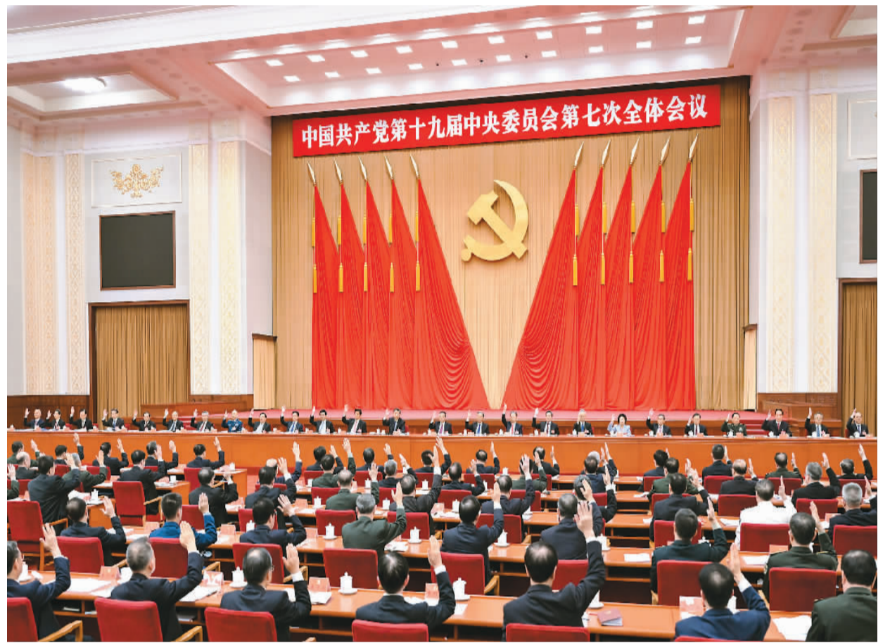
中国共产党第十九届中央委员会第七次全体会议,于2022年10月9日至12日在北京举行。中央政治局主持会议。